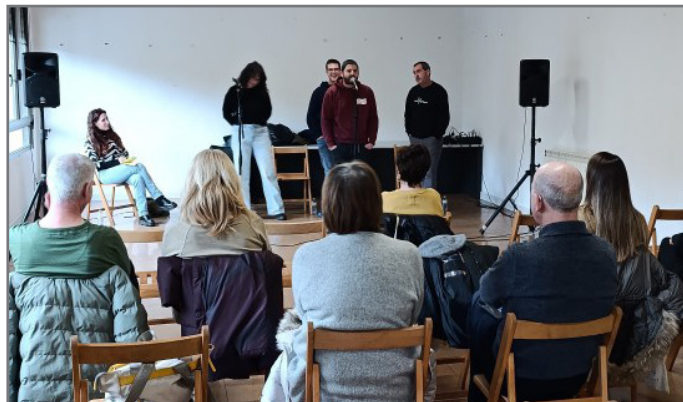
Eskuernagako saioa, abenduaren 15ean.. //XDZ

Hiru saio izango ditu aurtengo edizioak, hiru eskualde arabarretako hiru udalerritan: Eskuernagan, Langraizen eta Izarran. Lehen biak jokatu dituzte dagoeneko, Eskuernagan eta Langraizen: Izarrakoa baino ez da falta, abenduaren 28an, 19:00etan, kultur etxean.