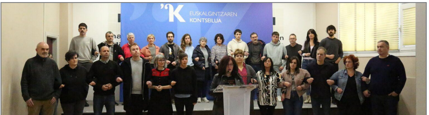
EuskaGintzako hainbat eragile izan ziren agerraldian; tartean, Bertsozale Elkarteko kideak.. //XDZ

prozesuan mugari izan nahi du datorren urteak, eta ekimen gehiago aurkeztuko dituzte laister. Azaroaren 9an Bilbon euskara larrialdi linguistikoan dagoela zehaztearen ondotik, ekiteko garaia dela zehaztu dute hainbat eragilek; tartean, Bertsozale Elkarteak.