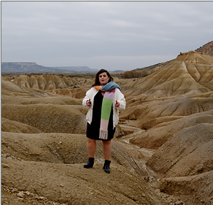
Bardeetan grabatu dute aurtengo Hitzetik Hortzera berezia. //XDZ

2024ak eman duenaren errepasoa egingo du Hitzetik Hortzerak urteko azken programan; 15 bertso jaialdi zein mahai bueltako jasoko ditu errepasoak.