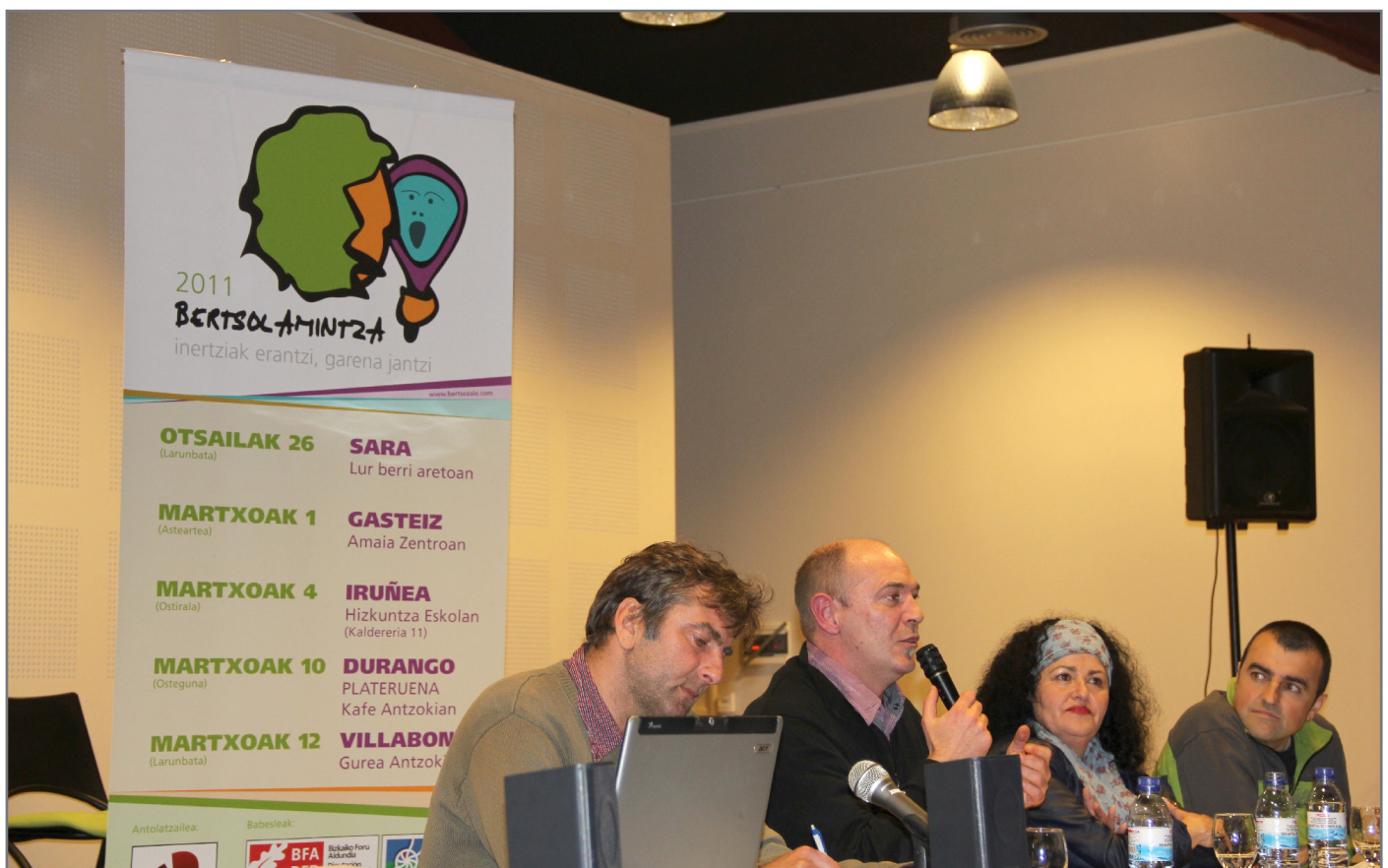
2011ko Bertsolamintzaren artxiboko argazkia.