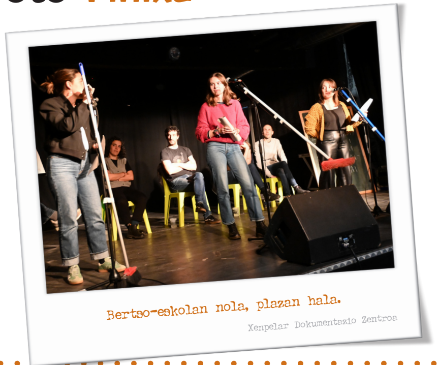
Bertso-eskolan nola, plazan hala.