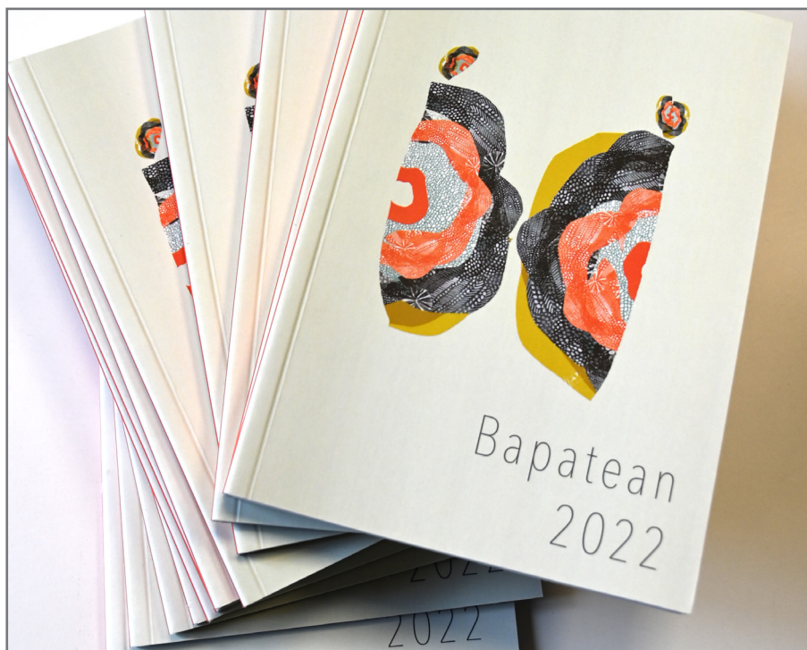
2022ko Bapatean bildumaren artxiboko argazkia. //XDZ

Anitz jenderen lanaren emaitza da liburu hau. Borondatezko grabatzaileen zerrenda luzea da eta guztioi esker jaso ahal izan dira grabazioak eta potretak. Beraz, eskerrik beroenak bihotz-bihotzez saio erdi, oso bat edo hamaika grabatu, edo argazkiren bat egin eta XDZra helarazi dizkiguzuen hainbeste bertsozaleri.