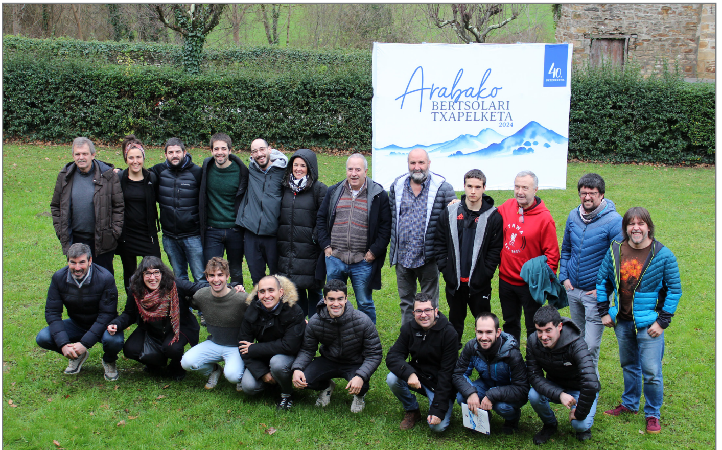
Urtarrilaren 13an aurkeztu zen Arabako Bertsolari Txapelketa. //XDZ