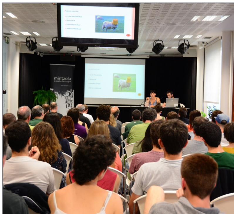
2019an egin ziren azken Bertsolamintza jardunaldiak.