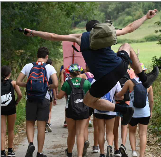
Hezitzaileen izen-ematea otsailaren 1ean hasiko da eta martxoaren 4an gazte parte-hartzaileena

Gogoraziko dizkizuegu datak garaia hurbildu ahala!