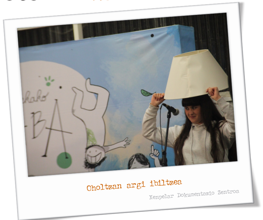
Oholtzan argi ibiltzea