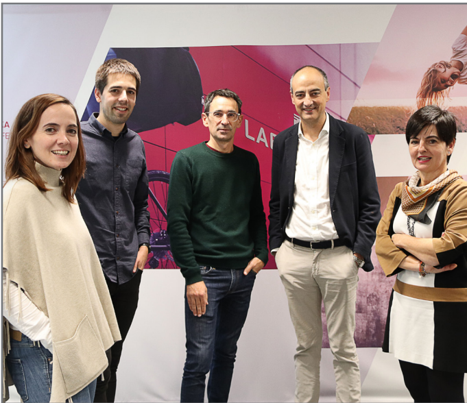
Arrasaten elkartu ginen hilaren 10ean Bertsozale Elkarteko eta Laboral Kutxako ordezkariak. //XDZ

Hitzarmen honi eta LABORAL Kutxaren ekarpenari esker, bertsolaritzak bultzada handia jasoko du beste lau urtean.