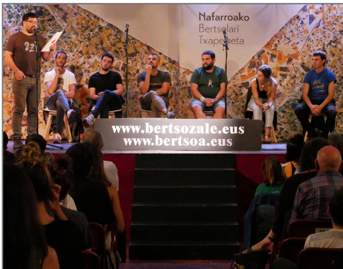
Lehendabizikoz Vianan izan da Nafarroako Bertsolari Txapelketa. //XDZ

2024an izango da bertsolari arabarren txanda; urtearen hasieran izan ohi da Arabako Bertsolari Txapelketa. Aurretik, ordea, kanporaketa fase bat izaten da, eta udazkenean izango da hori: lau saio izango dira, eta lehendabizikoa ostiral honetan jokatuko da Izorian.