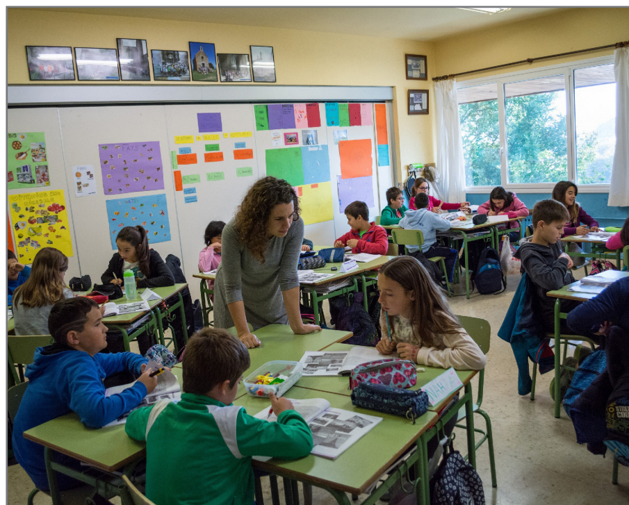
235 herri eta 513 ikastetxetan eskainiko da bertsolaritza Bertsozale Elkartearen bidez. //XDZ

Ziur etxetik hurbil izango duzula bertso-eskolaren bat. Interesa izanez gero, jarri harremanetan zure lurraldeko Bertsozale Elkartearekin eta lagunduko zaitugu gertuen duzuna topatzen eta harremanetan jartzen.