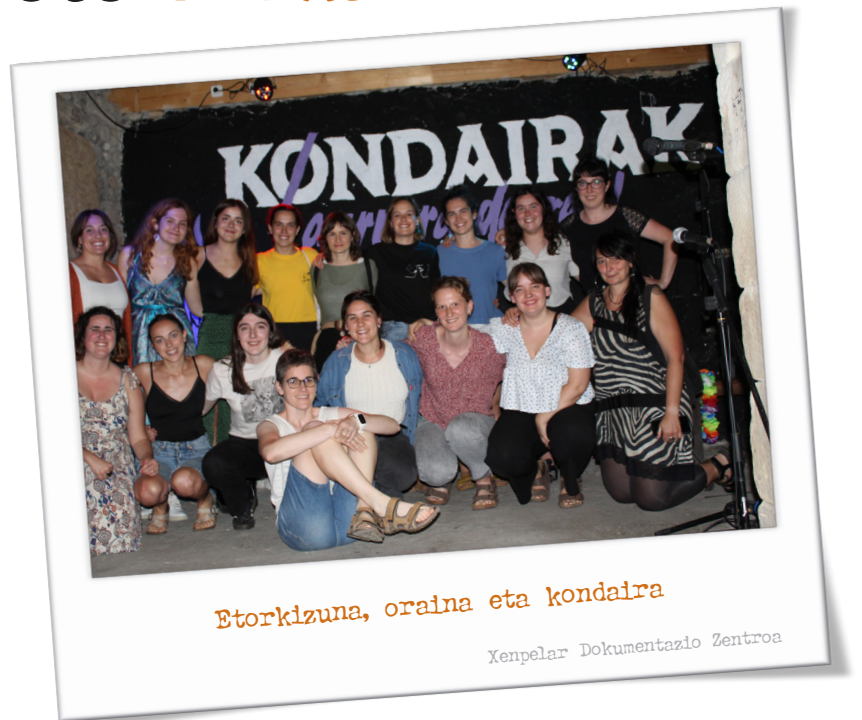
Etorkizuna, oraina eta kondaira