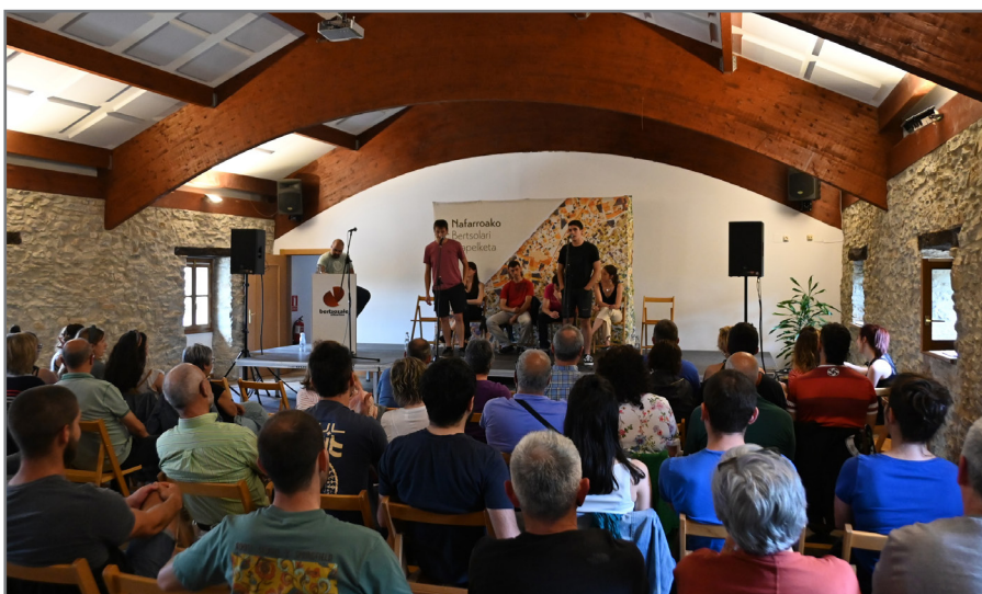
Urritik abendura bitartean jokatu dira Nafarroako eta Bizkaiko Txapelketak.