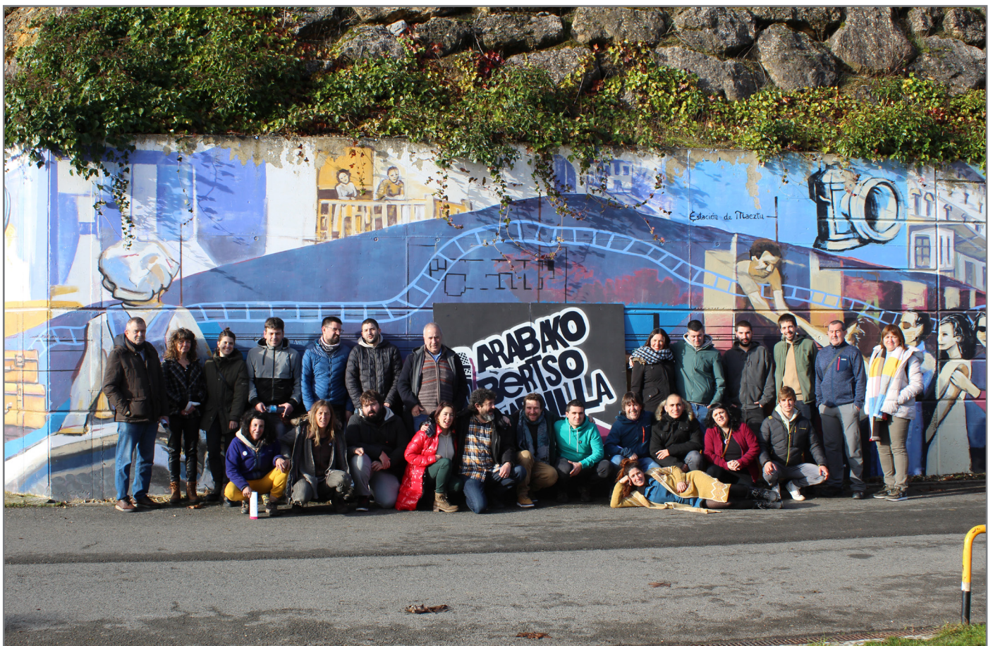
Maetzun aurkeztu dute Arabako Kuadrillartekoa. // XDZ

Txapelketaren jarraipena eta informazio guztia www.bertsozale.eus/eu/araba atarian izango duzue.