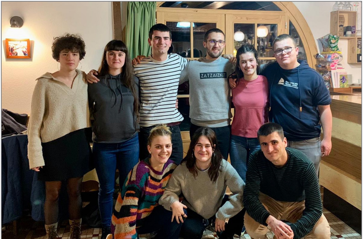
Urtarrilaren 27an jokatuko da Bertsuxurlako finala Hendaian. //XDZ-Alberto Eloseg

Ez dakigu oraino bainan horrela segitzen badu, polita izanen zen ekimen hau