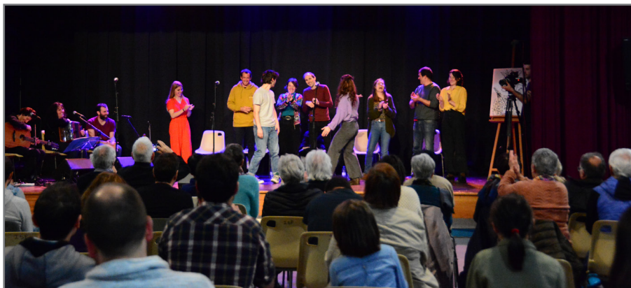
Azpeitiko Elikagunean egingo da gaueko bertso afaria, xehetasunak www.bertsozale.eus atarian.

Herriak ta hizkuntzak zuten norantzari gai gehio lotu zaio lehengo ardatzari ta munduak hartu dun itxura latzari aurre egiteko, beraz, laguna altxa hadi! Bultza hainbat borroka ederren martxari kontrapisu eginez eskuin balantzari txapela bete indar mingaina dantzari borroka irabazteko desesperantzari!