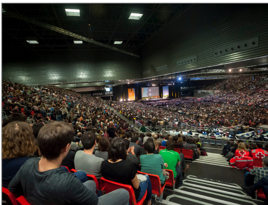
Egon daitezkeen eguneratzen berri izateko, eguna hurbildu ahala begiratu arretaz oharrrak www.bertsozale.eus webgunean.