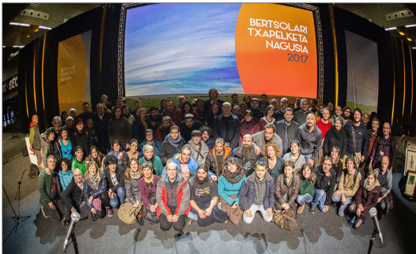
2017an ere talde handia osatu zen bertako eta nazioarteko adituekin.