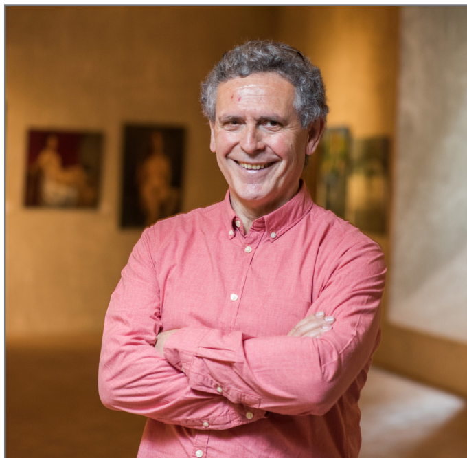
Abenduaren 18an “egun biribila bizitzeko itxaropenez eta ilusioz” dago Murua. // XDZ