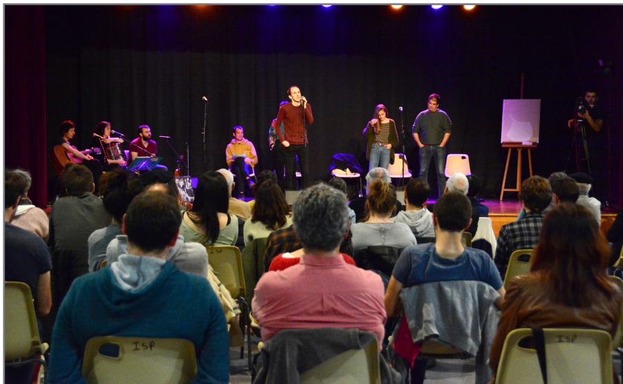
2022an Izpuran egin zen Bertso Eguna. //XDZ

Sorta osoa eta gainerako lan sarituak: https://www.bertsozale.eus/eu/nafarroa/iruneko-bertso-paper-lehiaketa