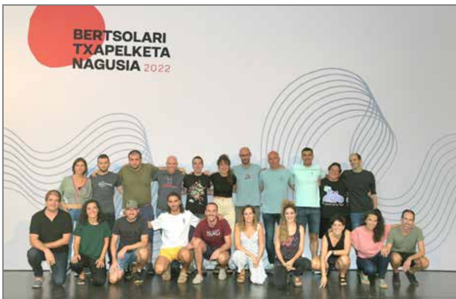
Irailaren 15ean egin genuen Txapelketa Nagusiaren aurkezpen ekitaldia. //XDZ

Lizardi Sariko bertsoaldiak www.bertsoa.eus atarian.