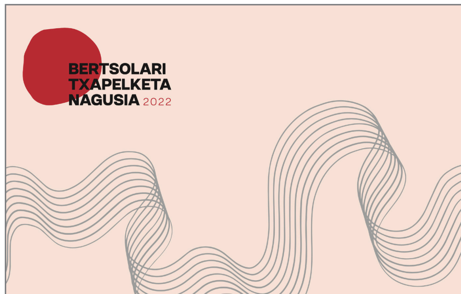
Aurtengo Bertsolari Txapelketa Nagusiko irudia. //XDZ

Sarrerak aukeratzen joateko, hurrengo orrialdean dituzu txapelketa honetako egutegiaren xehetasunak.