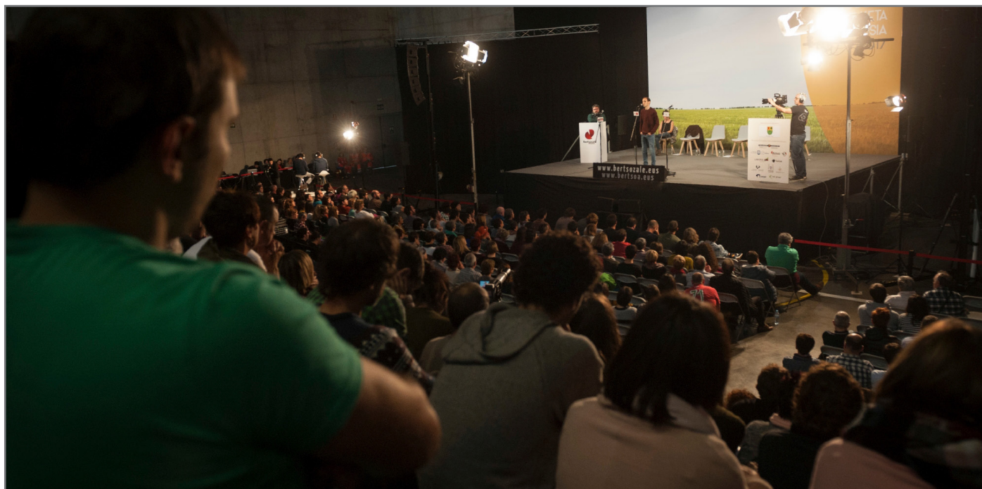
Hamalau saio izango dira guztira. Bazkideek, ohi bezala, abantailak izango dituzte prezioan. //XDZ

Beste hainbat hedabide ere izango ditugu bidelagun.