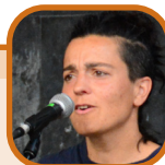
MAIALEN LUJANBIO ZUGASTI Tolosa, 2022-01-22