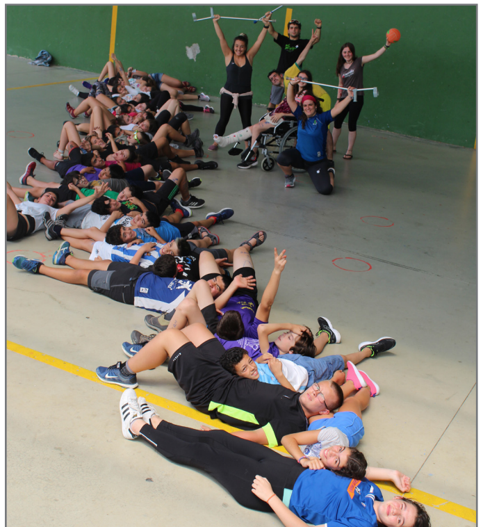
Amaiurren, Irañetan, Zuhatzan eta Larraulen izango dira txandak. //XDZ

Informazioa jasotzen duen eskuorria www.bertsozale.eus atarian dago eskuragai. Galderak izanez gero, deitu +34 943 694129 telefono zenbakira edota idatzi aisialdia@bertsozale.eus helbidera.