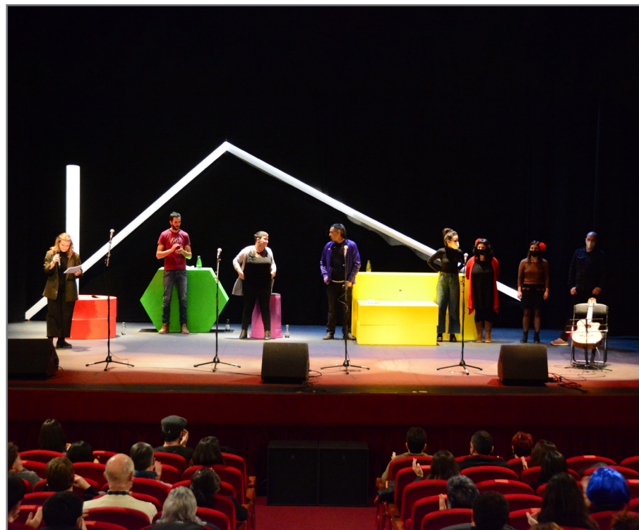
Iruñean egin genuen iaz Bertso Eguneako bat. //XDZ

Batzar Nagusirako izena eman behar da www.bertsozale.eus atarian argitaratutako izen-emate orria beteta. Martxoaren 18ko 12:00ak arte eman daiteke izena, eta mokadua egiten geratzekoa zaren adierazi beharko da bertan.