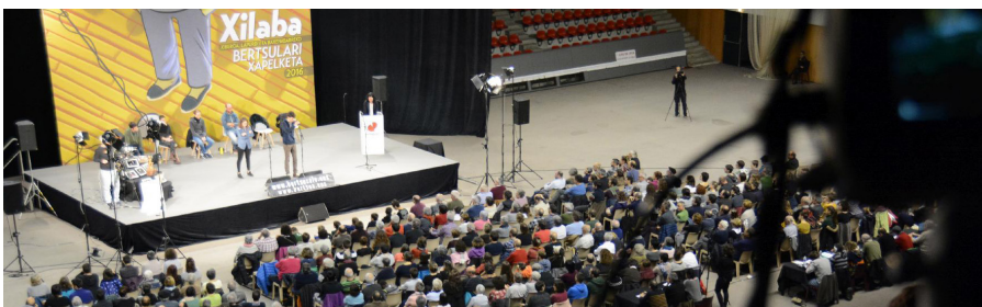
Pandemiaren eboluzioaren arabera beharrezko neurriak hartuko dira txapelketetan.

Jonen herrikide naiz baina ez moldeko ez bere ahots tinbre kantu dotoreko ez bere mezu zuzen edo umoreko pisu bat badudala ez dizuet gordeko batzutan sentitzen naiz bere oinordeko (bis) argi egiten duen baltzan koloreko.