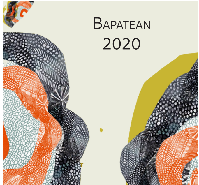
Bapatean 2020 bildumaren azala.

Argitalpena online jarriko dugu deskargatzeko moduan, eta audioak ere entzungai izango dituzue egun gutxi barru. Gozatzeko moduko altxorrak.