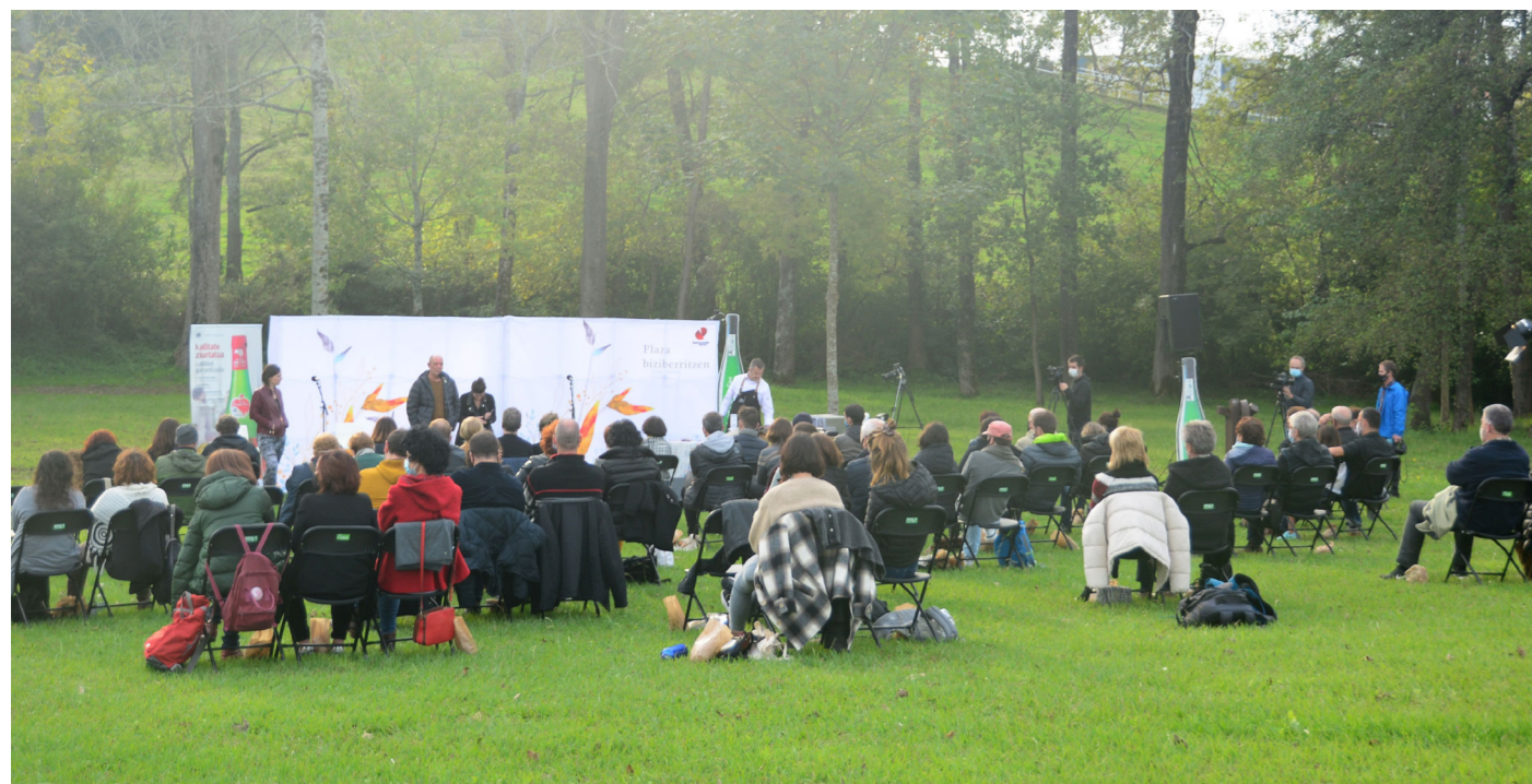
Gai desberdinen inguruko bidaia proposatu ditugu, saioen bidez saiakera berritzaileak egiteko. / XDZ

Saiorako sarrerak eskuragai daude www.bertsosarrerak.eus atarian.