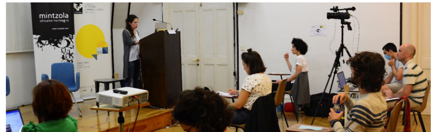
Zabalik dago Uda Ikastaroetako matrikula epea.

Ikastaroan izena emateko aukera zabalik dago. 77 euro balio du matrikula arruntak, baina badaude prezio murriztuak ere kasuan kasu; horiek ikusteko, sartu www.uik.eus atarian.