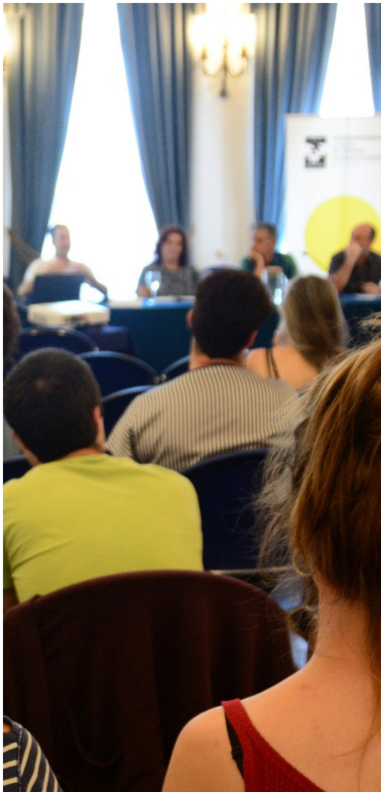
Zabalik dago Udako Ikastaroetarako izena emateko epea / XDZ

UEUk bere eskaintzaren baitan iragarria zuen jada Mintzola Ahozko Lantegiak antolatutako Udako Bertso Eskola bi eguneko ikastaroa. Iruñeko Katakrazen zen egitekoa, ekainaren amaieran, baina egungo egoerara moldatu behar izateak dinamika bera asko baldintzatzen zuen, tailer itxurakoa izanik, eta hurrengo urtean egitea erabaki dugu. Jakinaren gainean izango zaituztegu.