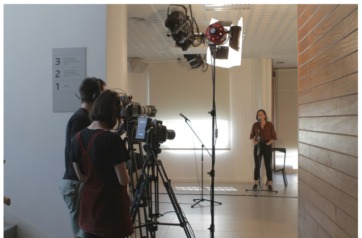
Aretoak segurtasun neurriak betez prestatzen ditugu / XDZ

Eragileak ohiko plaza martxan jartzeko ahaleginak egiten ari dira, baina horiek orain arteko moduan eskaintzeko oraindik denbora beharko da. Beraz, bitartean, sareko plazak bertsotan jarraituko du.