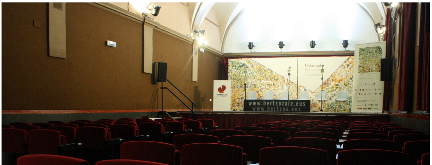
Potokastak, Plaza eta Bidaiak dira egitasmo berriak.//XDZ

Bestalde, Bertsozale Elkarteko funtzionamenduari buruzko parte-hartze prozesua egitera gindoazen. Lanketaren epeak atzeratu ditu egoera berriak, baina egokitze ariketa hauek guztiek etorkizunerako oinarriak fintzen ere lagundu digute.