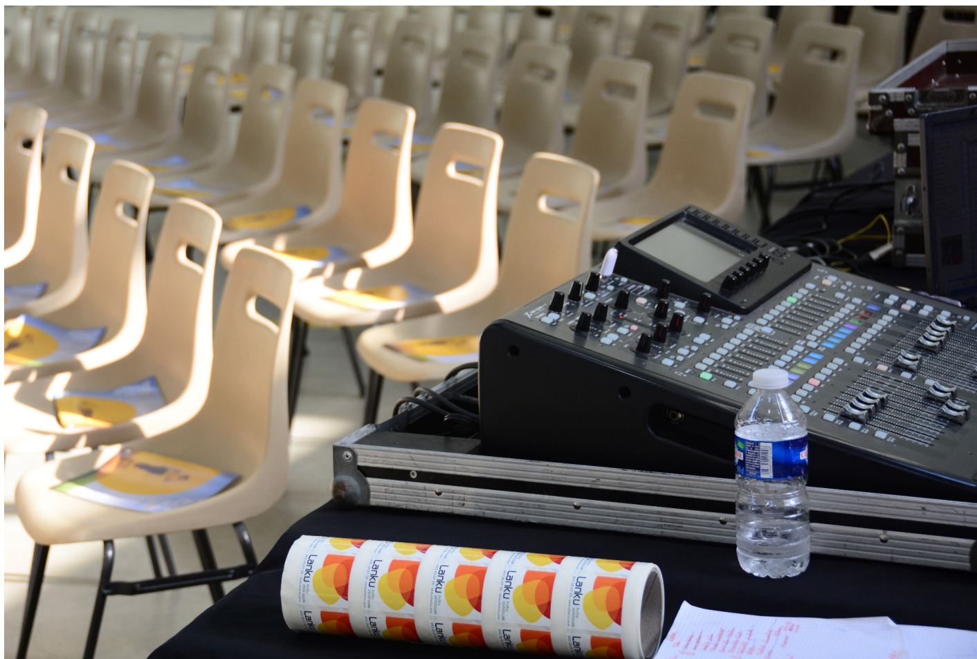
Plazaren etetearen ondorioz, Lanku Kultur Zerbitzuak larrialdiko ERTE egoeran dago.