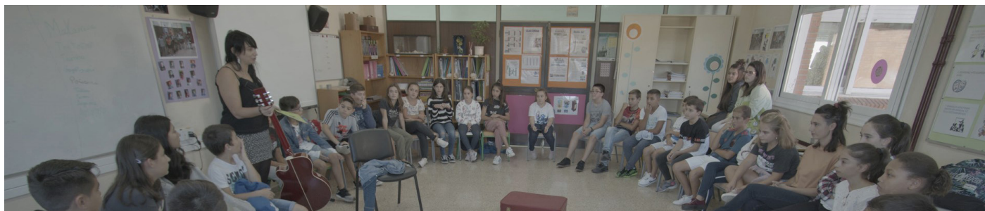
Hezkuntza arautuko ikasleak bertsolaritzako irakaslearekin. . XDZ

Bertsolaritzaz gain, beste kultur adierazpide batzuk ezagutzeko aukera emango digute hiru ekimen hauek: Gabonetako Ahotz Baten sormen egonaldiak, unibertsitateko ikasleei zuzendutako Ahostegunak ekimenak zein Gasteizko Gazte Sortegiak egitasmoak.