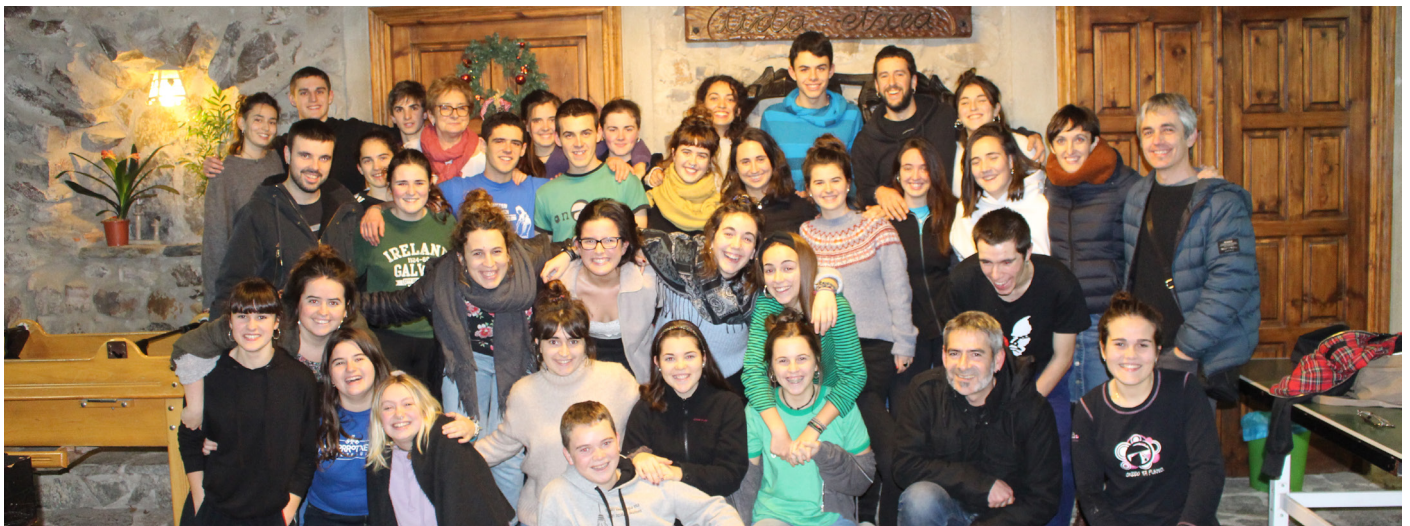
Ahostegunak ekimena Ahots Baten Sormen egonaldietan oinarritua da. / XDZ

Unibertsitateko ikasleek eskurago izango duten arren, ateak irekita dituzte interesa duten 18 eta 22 urte bitarteko gazte guztiek. Sarrera doakoa da, baina aurrez izena eman beharko da www.mintzola.eus atarian egokitutako izen-emate orrian. Urriaren 21era bitarte eman ahal izango da izena.