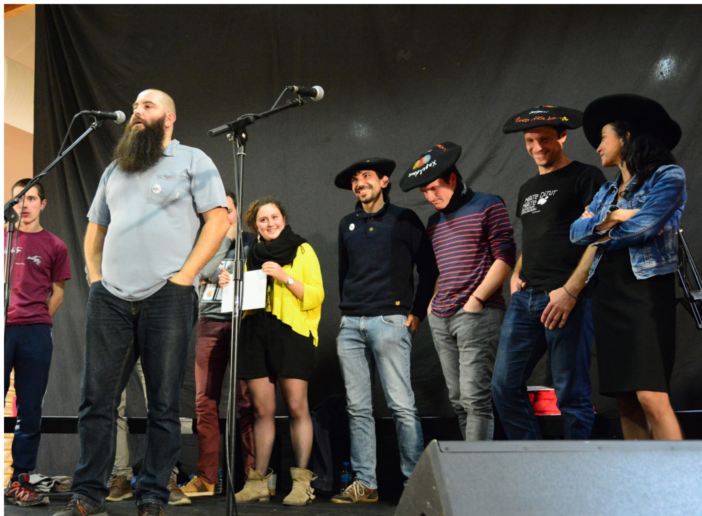
Izturitzen jokatuko da taldekako Xilabaren finala azaroaren 16an. XDZ

Dena prest dago txapelketari ekiteko; has dadila festa!