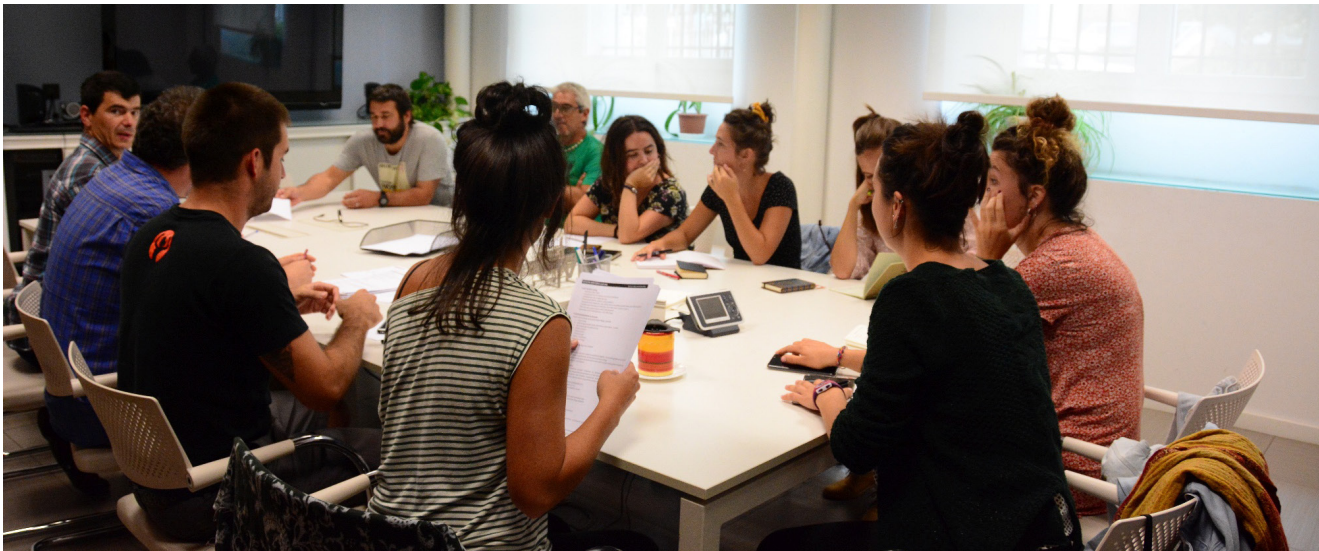
Maleta beteta dakar Hitzetik Hortzerako lantaldeak.

Asteroko saioaz gain, udan etenik izan ez duen www.bertsoa.eus atariak bere ohiko jardunarekin jarraituko du.