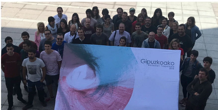
Asteasuko plazan egin zen Gipuzkoako Bertsolari Txapelketaren aurkezpen ekitaldia. / XDZ

Lehenik eta behin muxu bat zuei ta atzekoentzat Gaur epai irizpideak alde izan ditut behintzat baina oraindik batzutan hartzen gaituzte kideztat emakume florerotzat beste batzutan umetzat... Beraz txapel hau bertsotan dauden emakumeentzat nere ondoan indarra eman didaten ahizpentzat bertsotan jarraitu nahi dut zuekin eta zuentzat