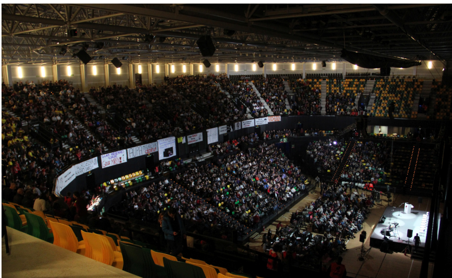
15:30ean zabalduko dira Bilbao Arenako atek. / XDZ

Zein ederra dan gaur paparretan ikustea hainbat txapa gure ohituren aldaketa hau orain aurrera doa ta egutegian markatuta neukan nik abenduaren bata amua bota bota egin dot baina falta zan karnata ni finalera lasai joango naz ederra izango da ta. (bis)