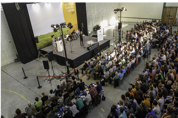
Bertso Udalekuak, Euskal Herriko zein lurraldeetako txapelketak, Hitzetik Hortzera... hamaika egitasmo jarri dira abian urteotan.//XDZ