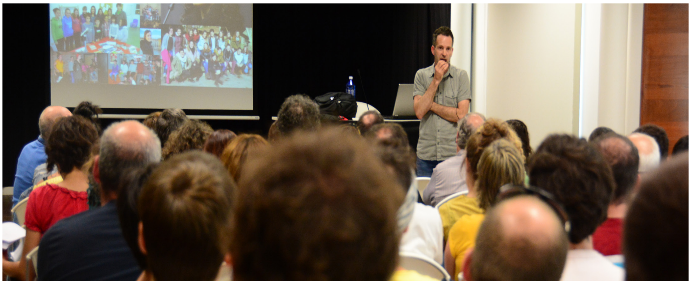
Gogoeta estrategikoaren lehen fasean, ikerketa soziologikoaren emaitzak aurkeztu ziren. //XDZ

Horregatik, Bertsozale Elkarteko bazkideok bai iraileko tailerretan bai azaroko gogoetaldian parte hartzeko deia luzatu du zuzendaritzako kideak. "Sekulako energia daukagu, bai proiektuz eta baita ekipoz ere, eta elkar zainduz, borondatez lanean aritzeko gune zoragarria da bertsolaritza. Eta, berekoia izanik, ez dago norberaren burua lantzeko eta ikasteko taldean aritzea baino ariketa osasuntsuagorik".