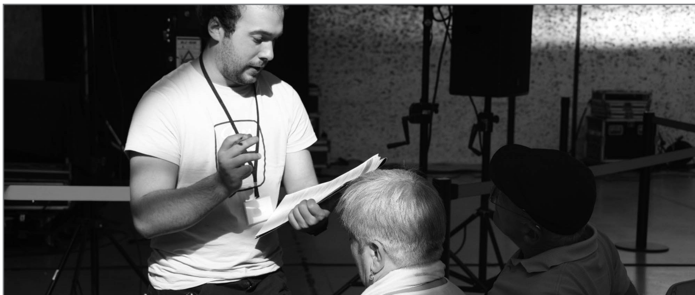
Inkestatzaileak ibiliko dira saioz saio bertsozaleei galderak egiten.//XDZ

Saioetara zoaztenean, beraz, han ikusiko dituzue inkestatzaileak. Eta bertsozaleok galdetegiak erantzutera animatu nahi zaituztegu, bertsolariaren etorkizuneko pausoak ematen laguntzeko.