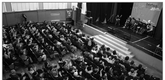
Udazkenean bertan sartuko da indarrean neurria. //XDZ

Nafarroako Kultura Kontseiluak prestaturiko txostenaren tramiteak bukatutakoan sartuko da indarrean neurria, aurtengo udazkenean bertan.