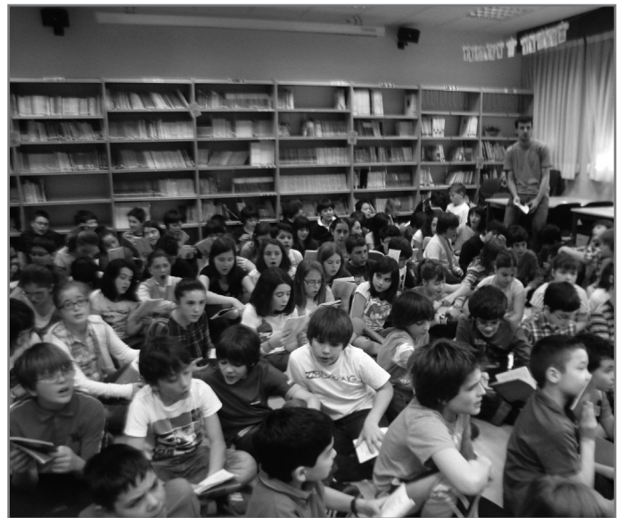
Euskal Herriko lurralde guztietan eskaintzen da bertsolaritza ikastetxeetan. //XDZ

Inguruan zein bertso-eskola dituzun jakin nahi izanez gero, eta izena emateko egin beharrekoak jakiteko, jarri harremanetan zure herrialdeko Bertsozale Elkartearekin.