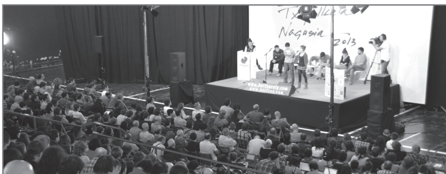
Txapelketako abonamendua bazkideen eskura egongo da soilik.//XDZ

Gero Hondarribira doaz gure hitzak berdintasuna neskei banatuz saritzat. Gogor saiatuz egi baitira ametsak atzean utziz lehengo une gogor beltzak. Esker mila deneri erreza da behintzat nere txapela zuei esker ta zuentzat.