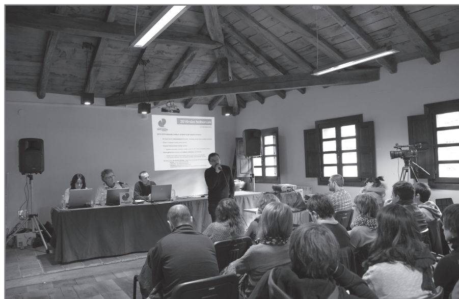
2016ko Batzar Nagusia.//XDZ

Otsailaren 18an egin du Bertsularien Lagunak Elkarteak Senperen eta azkenik, martxoaren 11n egingo du berea Bizkaiko elkarteak.