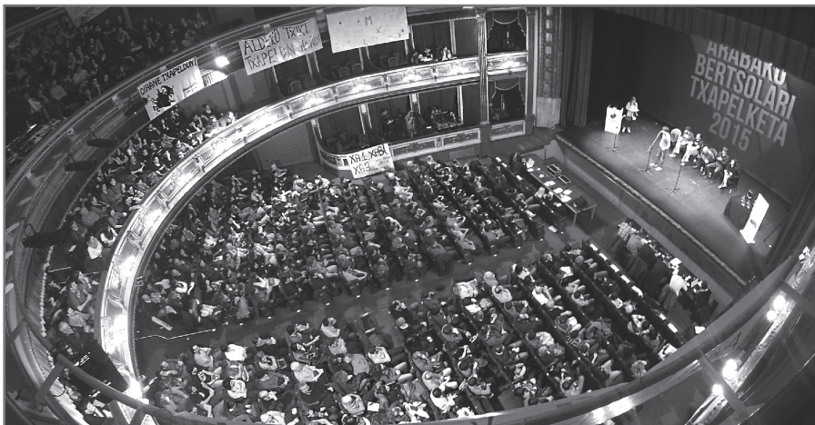
Principal antzokian izango da finala apirilaren 1ean.//XDZ

Lehen eupada senide, lagun ta etxeko lau izarrontzat, gogoan dodaz bertso eskola ta eguezteneroko aitortzak. Hasikerako maisu zirenak ta gaurko ikasle zorrotzak, Almeriaraino joan-etorriko bitak indau nire ahotsak. Ta berez doble pozten nauenez inguruko danen pozak, bigundualdi bat hartu berri dau nire harrizko bihotzak. Hau euskal kultur zein herrigintzan gogoz zabizienontzat, txapel bana ta gehiau merezi dau zuetako bakotzak.