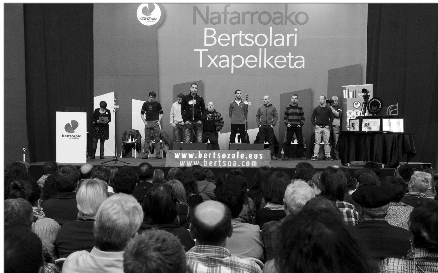
Abenduaren 16an jokatu da txapelketako kanporaketa Nafarroan.