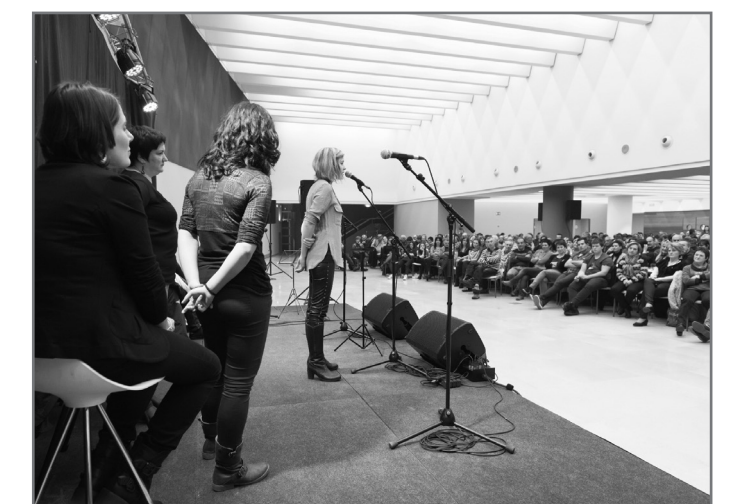
2018an molde berri batekin itzuliko da Bertso Eguna.//XDZ

Plaza ederra da Donostiakoa eta aurrerantzean ere bertsolaritzaz gozatzeko aukera dezente izango ditu bertsozaleak Donostian.