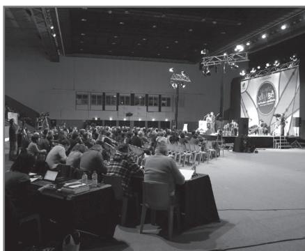
Duela bi urte bezala Baionako Lauga jokatu da finala.