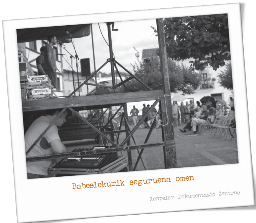
Babeslekurik seguruenaren omen