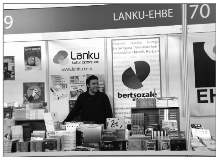
Bertsoaritzarekin lotutako materiala aurkituko duzue gure postuan.//XDZ

Gipuzkoako Bertsolari Txapelketa 2015 liburua eta CDa. Gipuzkoako Txapelketako fase ezberdinetako bertsoen hautaketa zabala jaso da. Txapelketan parte hartu zuten bertsolari guztien bertsoak ageri dira eta finala oso-osorik aurki daiteke. Liburuan dauden bertso guztiak daude audio formatuan.