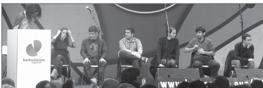
Duela bi urte bezala Baionako Laugan jokatu da Xilabako finala.//XDZ

Gogoan daukat haurra nintzela zure magalan epela bertso zaharrak zure ahotik noiznahi irteten zirela. Ordun ez zenun usteko ni gaur hemen egoterik, bela! Nahiz ta urtiak diran gugandik urruti joan zinela zauden tokian zaudela (bis) aitona zuri jantzi nahi dizut eman didaten txapela haurra nintzela zuria neri jantzen zenidan bezala. (bis)