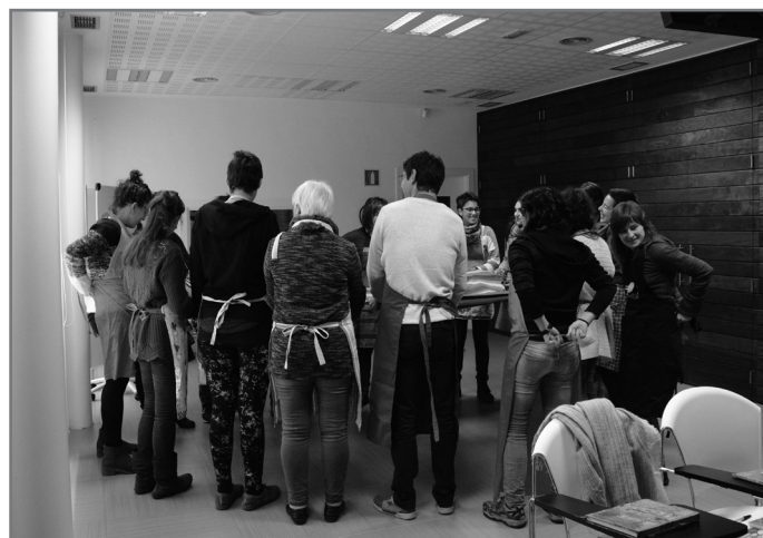
Harrera oso ona izan du Ahalduntze Bertso Eskolaren lehenengo edizioak. //XDZ

Bertsozale Elkarteko Genero saila da Ahalduntze Bertso-eskolako antolatzailea eta ekimen honetarako Emakunderen babesa jaso du.