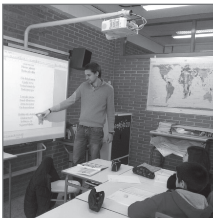
Herrialde guztietan lantzen da transmisio proiektua.//XDZ

Astebete igaro da berriz ere larunbata eta ibiliko gera taberna hortan bueltaka. Inoiz ez da lagungarri tabernetako zarata baino lotsa gordeko det eta beldurra aguanta. Oraingoan lortuko det hau azken aukera da ta eta hortxe hasiko naiz belar ondoan esaka "Aizu, hartu nahi al dezun lehengo asteko kubata?" (bis)