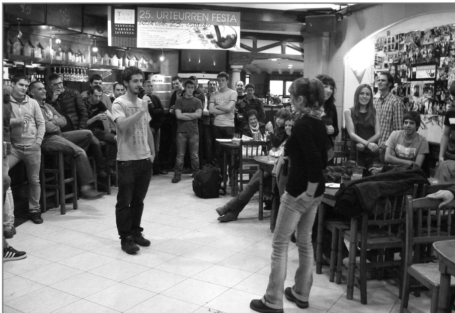
Egitarau zabala izango du Bertso-Eskolen Eguna.//XDZ

Azaroaren 14an Senperetik Agurainera egingo du salto urteroko BEEK, Bertso Eskolen Eguna. Aurtengo egundoko egitaraua izango dugu: bertso-poteoa, bazkaria, bazkalostea, kontzertua... Urriaren bigarren astean jakinaraziko ditugu xehetasun guztiak. Horrekin batera jarriko ditugu bazkaritarako eta lotarako tokia eskuratzeko sarrerak salgai, www.bertosarrerak.eus webgunean.