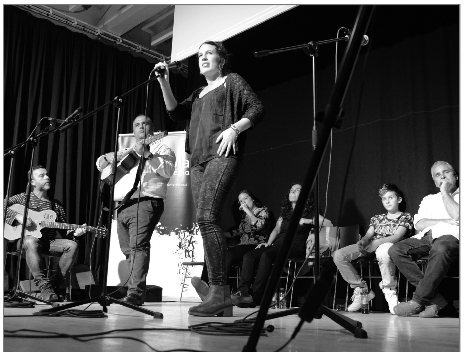
Igande arratsaldeetan emitituko dute Hitzetik Hortzera.//XDZ

Bartzelonako jardunaldiak azaroaren 6tik 8ra egingo ditugu.