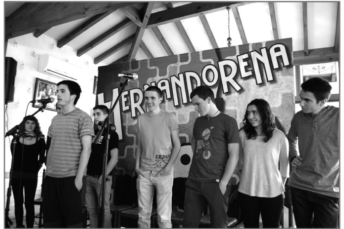
Bertsolari gazteek hartuko dute parte Hernandorenan. //Bertsularien Lagunak

Herriko Bixentainian jokatu da sariketa, 18:00etan hasita. Behin saioa amaituta afora izango da, Klika txarangak animatuta.