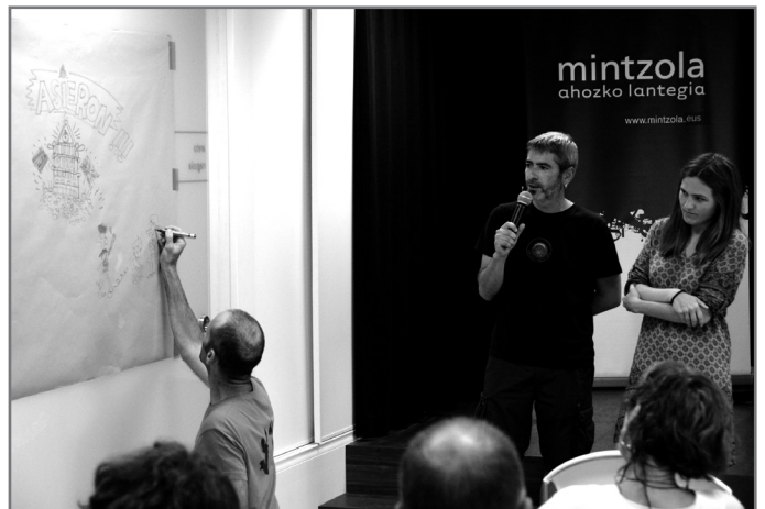
Emozioak eta umorea izan zen jardunaldien gaia.