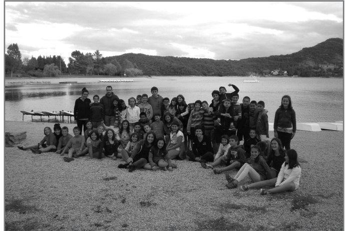
213 parte-hartzaile izan dituzte aurtengo bertso-udalekuek.//XDZ

Bertso-udalekuetako txandetan egindako laburpen bideoak ikusgai daude www.bertsoa.eus webgunean.