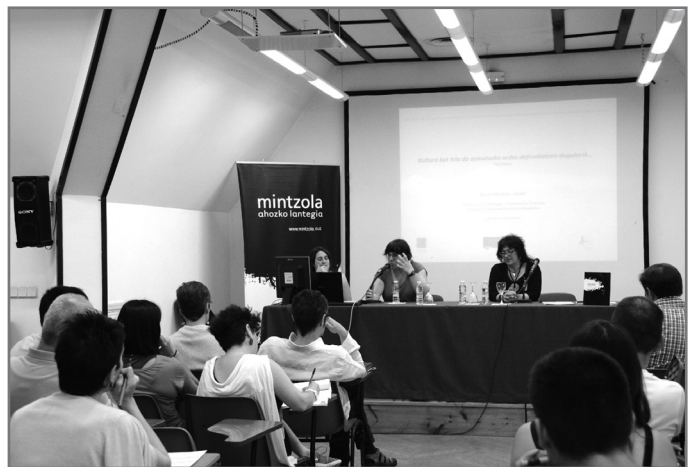
Bigarren edizioa egin du Bertsoa Unibertsitatean eskolak.//XDZ

Bi ikastaro izan ditu uztailean egin zen Bertsoa Unibertsitatean eskolaren bigarren edizioak. Lehena, ahozkoitasuna eta hezkuntza aratuaz izan zen, eta bigarrena bertsoaritzaren bidegurutzeetaz. Mintzolak eta Euskal Herriko Unibertsitateak elkarlanean antolatutako ekimenaren ardatz nagusia saio akademikoak izan ziren, baina horrez gain performance batekin gozatu zuten ikasleek.