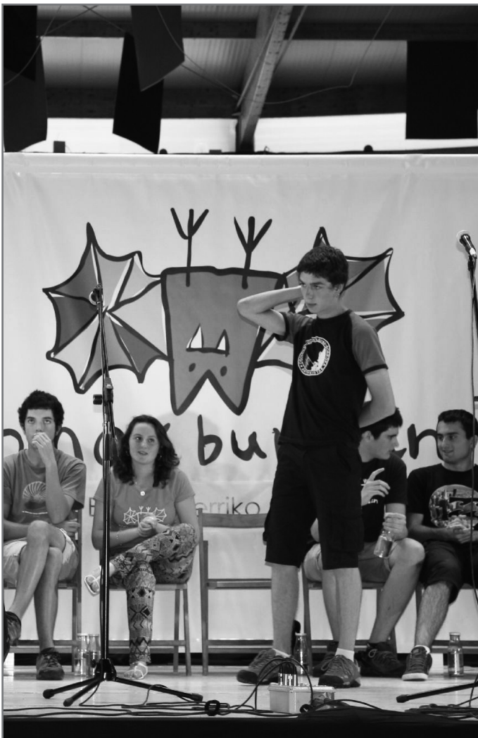
Aurten ere, Orion jokatu da Eskolartekoaren finala.//XDZ

Finaletarako autobusak zein bazkari txartelak www.bertsosarrerak.eus atarian jarriko dira salgai.