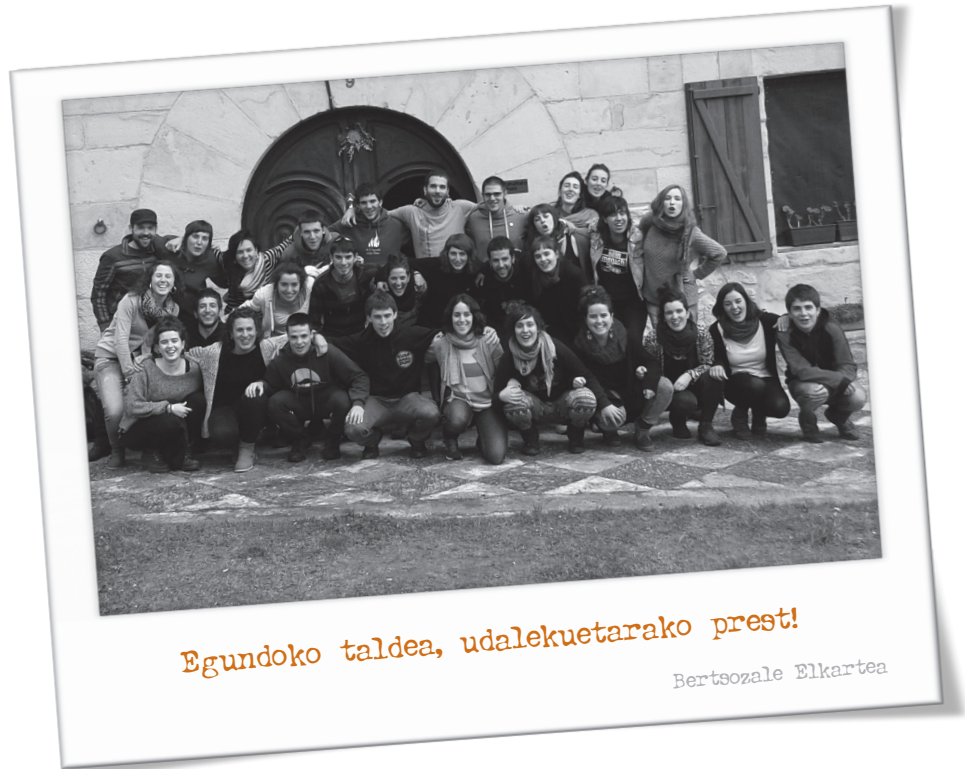
Egundoko taldea, udalekuetarako prest!