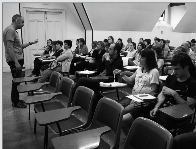
laz abiatu zen Bertsoa Unibertsitatean eskola.//XDZ