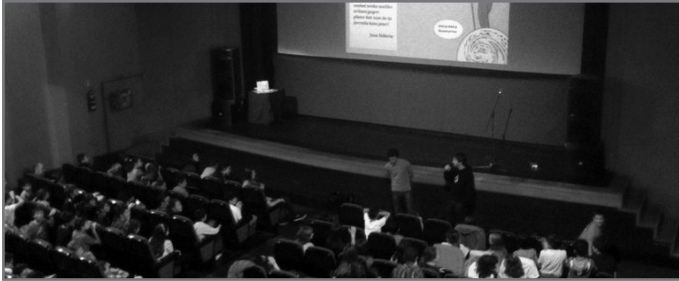
Oso harrera ona izaten dute bertso topaketek.

Tokian tokiko udal ordezkari eta euskara teknikarien laguntza eta parte hartzeari esker burutzen dira urtero topaketa hauek.