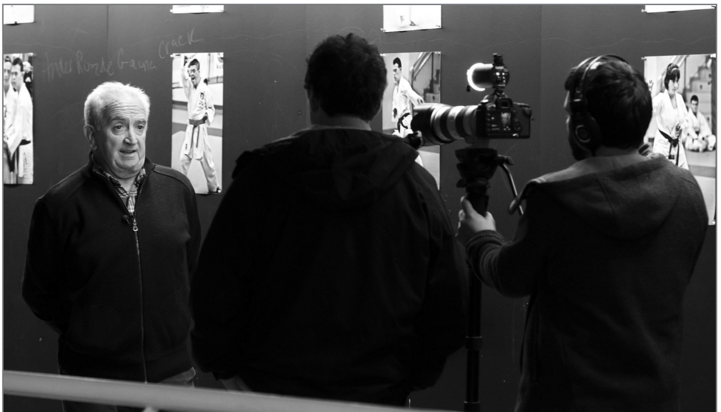
25 urte bete ditu Hitzetik Hortzera telebista saioak.//XDZ

Norabide horretan pausu berri bat eman dugu eta aurrerantzean hedabideak@bertsozale.eus helbide elektronikoa izango dugu martxan. Helbide hori Bertsoa.com zein Hitzetik Hortzerarekin kontaktatzeko bidea izango da. Horrez gain, horra zuen albisteak, abisuak, bideoak, jakinarazpenak eta abarrekokak bidal ditzakezue