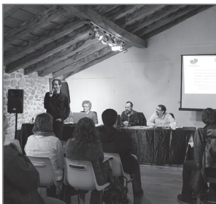
Senperen egindako batzar orokorraren une bat.//XDZ

Familiarentzat dira besarkadarik minenak gaizki nagoen unetan goraino naramatenak. Baina beste bat buruan hala agintzen du senak bide inexcrutableak direnez adinarenak gogoan ditut gazteak bertso-eskoletan daudenak bertso-ekosistemak mini bertso-ekosistemak herri hau euskaran bidez herri egiten dutenak.