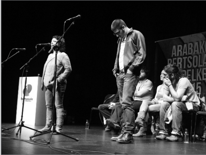
Dulantzin jokatu zen lehenengo saioa.

Urtarrilaren 25ean abiatu zen Dulantzin Arabako Bertsolari Txapelketako edizio berria. 18 bertsolari ari dira parte hartzen, eta martxoaren 21ean Gasteizen egingo den finala bitartean sei finalurreko jokatuko dituzte.