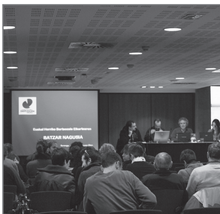
Durango, 2014ko Batzar Nagusia.