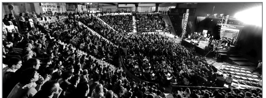
2013an Anaitasunan jokatu zen Nafarroako Txapelketako finala.//XDZ

Horrez, gain, www.bertsoa.com atariak ere txapelketaren jarraipen berezia egingo du.