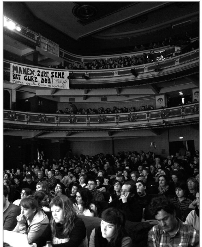
Aurten ere Gasteizko Principal antzokian jokatuko da Arabako finala, martxoaren 21ean.

Otsailaren 3an aurkeztuko dute ofizialki Nafarroako Bertsolari Txapelketa 2015.