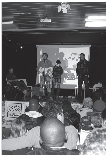
Duela bi urte, Markina-Xemeinen Bertso Korrikan egin zen saioa. //XDZ

Saioen inguruko xehetasun guztiak www.bertsozale.eus web gunean aurkituko dituzue.