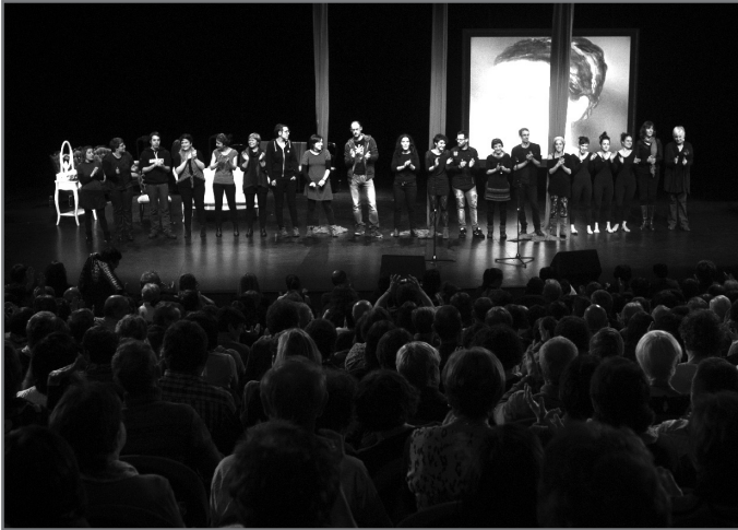
Iazko Bertso Eguneko ekitaldi nagusiko parte-hartzaileak.

Halere, ekitaldiaren xehetasunak azken astean emango ditu Bertsozale Elkarteak. Urtarrilaren 27an izango baita aurtengo Bertso Eguneko aurkezpen prentsaurrekoa.