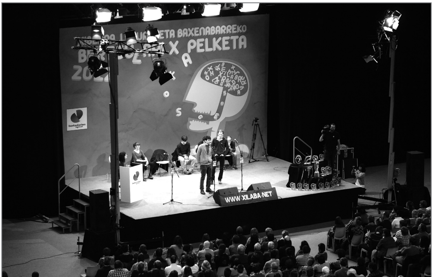
Baionako Lauga gelan jokatuko da Xilabako finala.

Bizkaiko Bertsolari Txapelketaren inguruko informazio osoa www.bertsozale.eus/bizkaikotxapelketa webgunean aurkituko duzue.