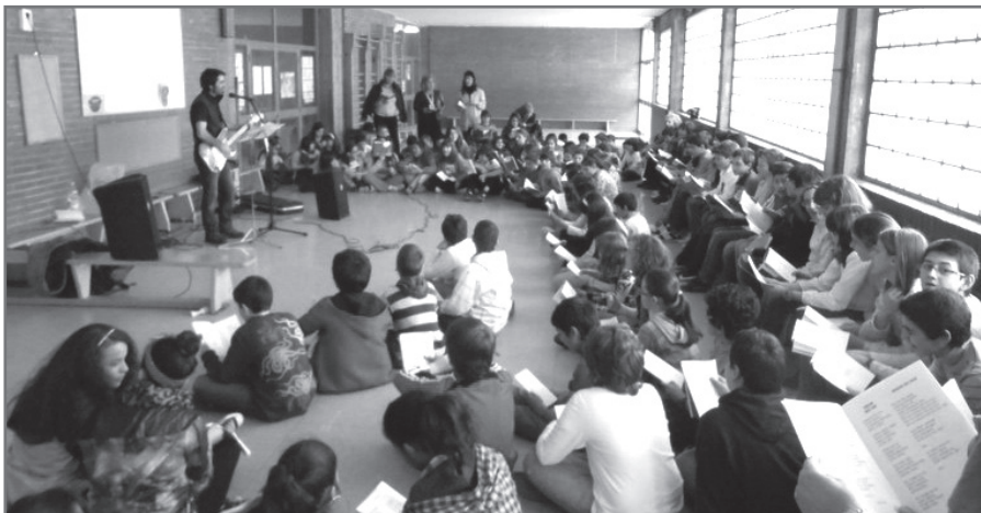
Eskolak ematearekin batera, bestelako hamaika ekimen egiten dira ikastetxeetan.

Iraganakin izan liteke pena edo arrangura bertsolaritza juzga liteke atzerakoian modura baina nik ere ezagutu nun lehengo bertso mundu hura ta zorionez denbora gutxin hau're asko aldatu da.