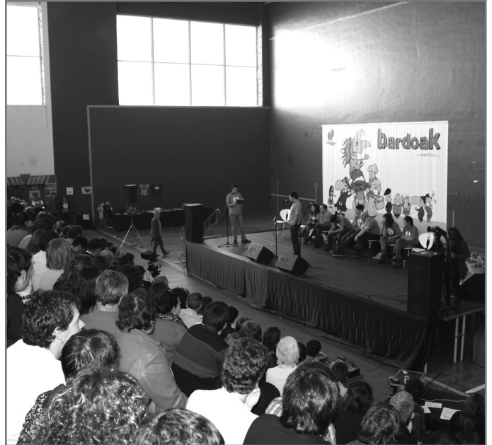
2012ko finaleko irudia.

Bardoen inguruko informazio osoa www.bertsozale.com/bardoak helbidean aurkituko duzue.