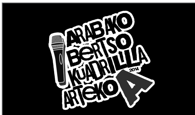
Arabako Bertso-kuadrilla Artekoa.//ABE

Aurtengo Kuadrilla Artekoak 20 saio izango ditu. Urtarrilaren 18an egingo dugu aurkezpen festa Agurainen. Otsailaren 1ean egingo da lehenengo saioa eta apirilaren 5eko topaketarekin borobilduko da. Herri askotatik pasako da herriak eta eskualdeak aktibatzen helburuarekin eta, zaletasuna bultzatuz, bertso-eskola eta talde berriak sortzeko asmoz.