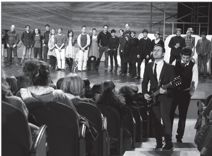
Bertso Eguna 2013.//Alberto Elosemi

Bestalde, saldu gabe geratzen diren sarrerak urtarrilaren 25ean bertan jarriko dira salgai Kursaaletan leihatiletan. Leihatilak arratsaldeko 16:30etan zabalduko dira.