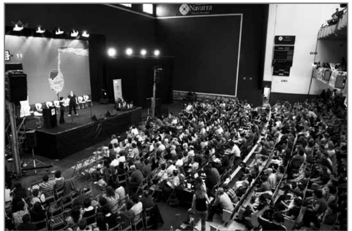
Orain dela bi urteko finala.//NBE

Txapelketaren gaineko informazio osoa eta gaurkotua www.nafarroakotxapelketa.com webgunean aurkituko duzue. Sare sozialen bitartez ere, txapelketaren informazioa jasotzeko aukera dago.