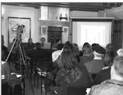
Iazko Batzar Nagusia.//XDZ

"Begira hori ze kalbo dagon" esanaz dabil jentea. Hala ta guztiz izan daiteke pertsona elegantea burmuin barruan dagoena da benetan inportantea. Beti izan naiz tipo abila eta inteligentea: laster batean azalduko dut nere buru brillantea.