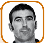
2013-02-16, Izarra

Batzar Nagusira joaterik ez daukanak apirileko Bertsozalean jasoko du bertan hitz egindakoaren berri.