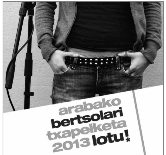
Txapelketako logoa.//Arabako Bertsozale Elkartea

Informazio gehiago aurki dezakezue www.arabakobertsozale.org webgunean. Hitzetik Hortzerak eta Bertsoa.comek ere jarraipen zabala egingo diote aurtengo txapelketari.