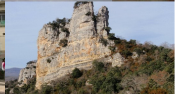
AZAROAREN 28an OSTIRALA 21:00etan KORREseko ELKARTEAN