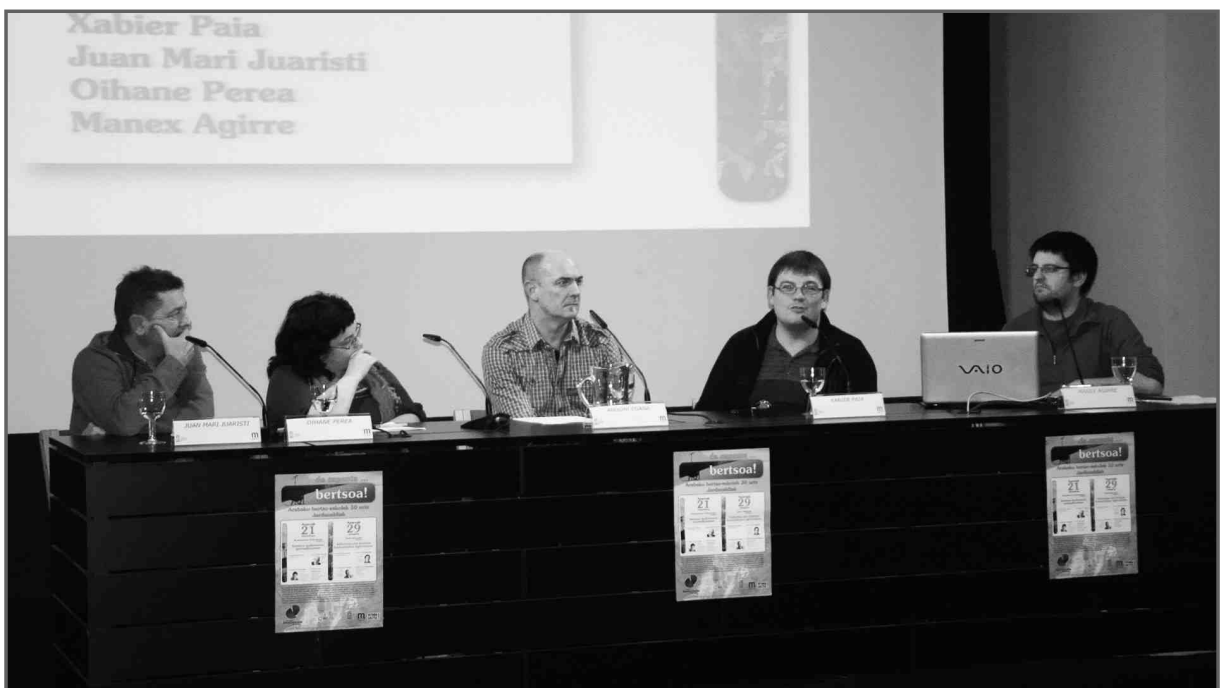
Lehen eguneko mahai-ingurua

XX. menderako idortua zen noizbait euskararentzako oihan izandako Araba ia osoa, bazen oasi txiki bat iparraldean, Aramaio eta Legutio inguruan, urtegiaren ingurumarian, baina bertsolaritzaren arrasto txirik ere ez. 1982an Gasteiz eta Aiaraldeko Bertso-eskolak sortu ziren, ikastolak, gaueskolak eta euskararen aldeko hainbat ekimen bezala lurra berriz loratzea amets zuten euskaltzale sutsuen ekimenez. Euskara eta galdutako nortasuna berreskuratzea ez zen erronka makala. Orain 30 urte pasa diren honetan, basamortua txikitzen eta hezeguneak ugaritzen ari dira gurean. Norbanako eta talde askoren lan eskergari esker, Araba dagoeneko ez da basamortu bat euskararentzat. Bertsolaritza ur goxo eta ongari izan da prozesu horretan eta hala izan beharko du aurrerantzean ere. Egindako bidez hausnartu eta aurrera begira oinarri sendoak jartzeko unea iritsi da. Hemen aurkezten dizkizuegun jardunaldi hauek horretarako tresna baliagarria izatea