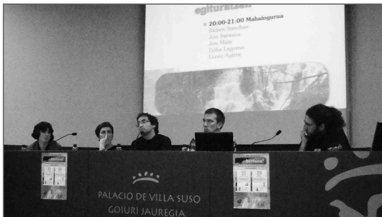
Urriaren 29ko parte-hartzaileak

Lehen norbaitek publikoan esan du Araban edo Gasteizen bertso eskolek egin dutela kultur jardun batetik jendea euskalduntzera bultzatu, eta, aldi berean, euskararen mundutik zetozenak kulturara etorri. Uste dut hau dela kasik formula magiko bat lortu