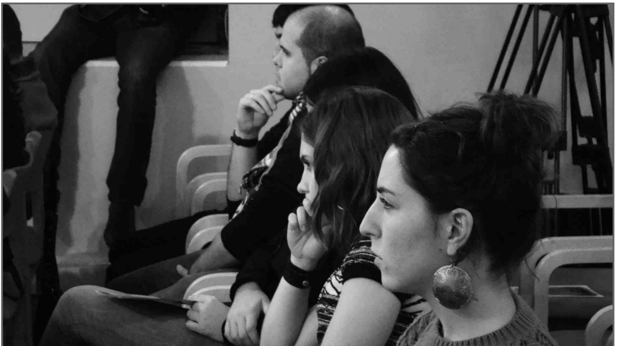
Bertsozale gazteak, adi

Txapela irabazi ondoren utzi zenion gasteiztar izateari?