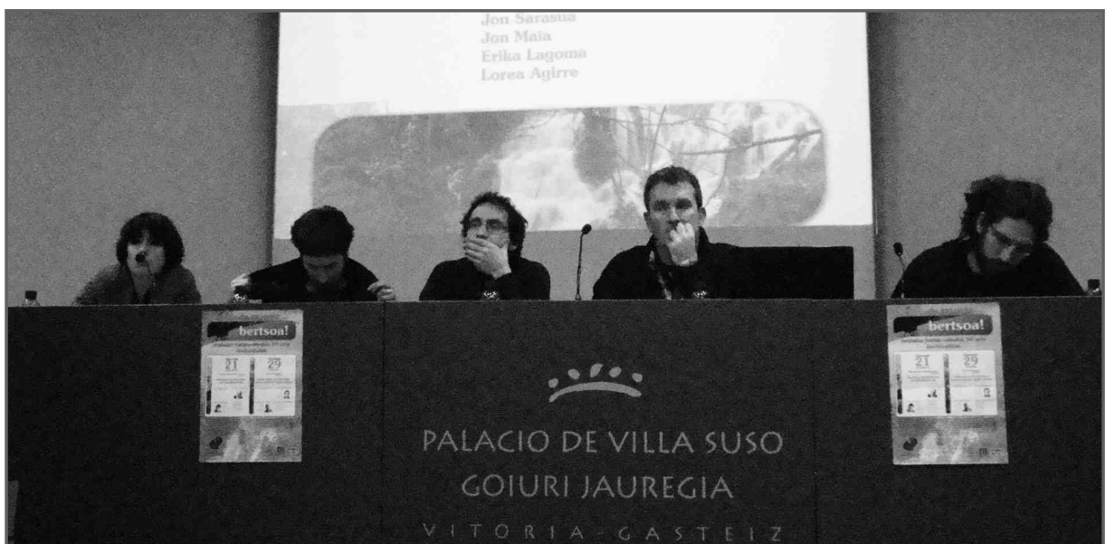
Urriak 29ko partaideak