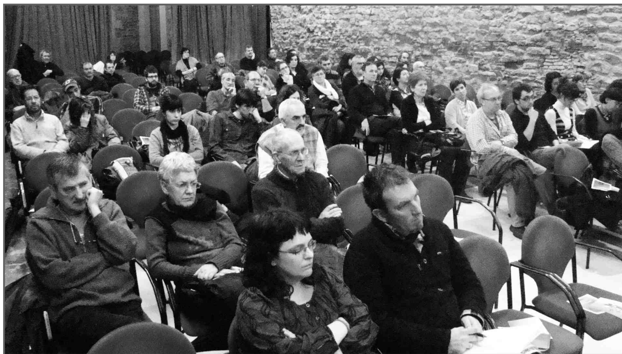
Goiuri jauregiko entzuleak

Horretan ari garela uste dut. Egia da nik gaur erabili dudan diskurtso mota honekin sor litekeela barruan har bat esateko "Jode, honelako etxeko lan txiki, luze eta eskergabekoak ditugu? Noiz etorri behar da Estatua euskara salbatzera behingoz! Ibili gabe tokian tokiko babarrun eltze txiki horiei sua ematen, kostatzen denarekin!". Badugu barruan baita ere protesta egiten duen hori. Gauza asko esan liteke honetaz ere; arlo guztietako estrategiak landu behar dira, baina garbi eduki behar dugu mende honetako datozen hamarraldietan zein izango diren gure benetako hiztun kondizioak, zein den benetan euskal hiztun hautua egin duen baten hiztun kondizioa, non dauden erabilera horien gakoak, zer gertatzen ari den gure belaunaldi berrietan, eta horri aurre egiteko gakoak non ditugun.