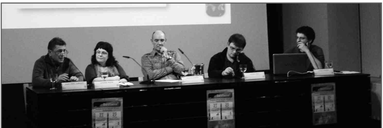
Urriaren 21eko partaideak

Eskerrik asko denei etortzeagatik eta eskerrik asko hizlariei.