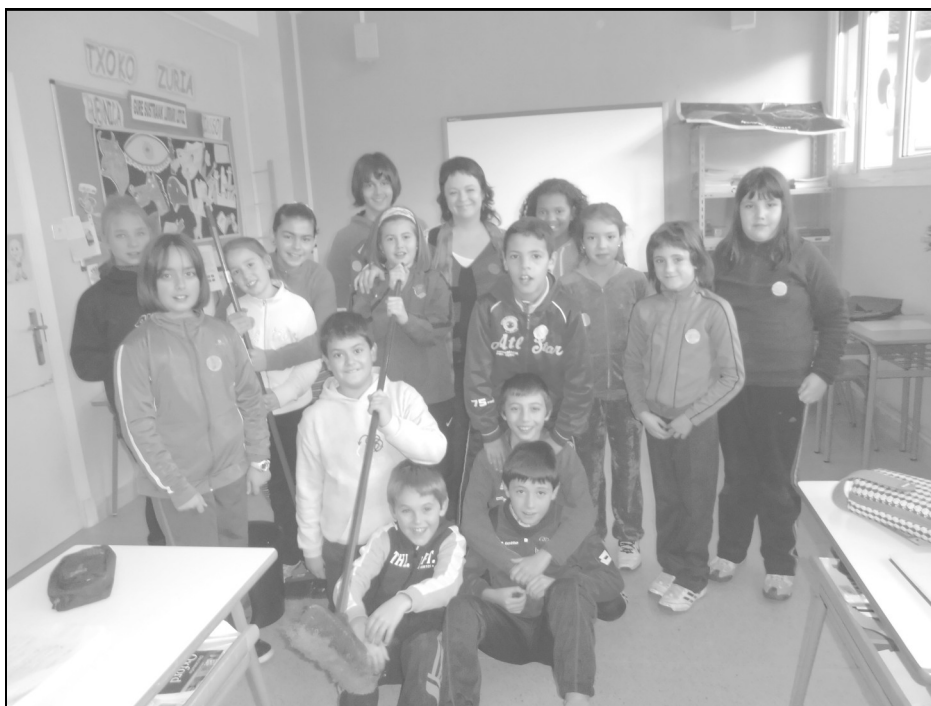
Lautada ikastola - Agurain 5. maila