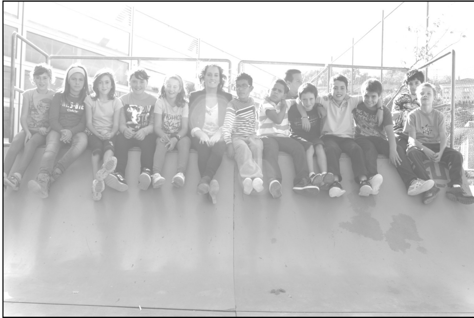
Ibernaloko ikastola - Kanpezu 5. maila