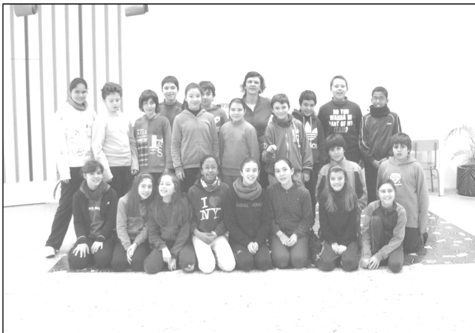
Lautada ikastola - Agurain 6. maila