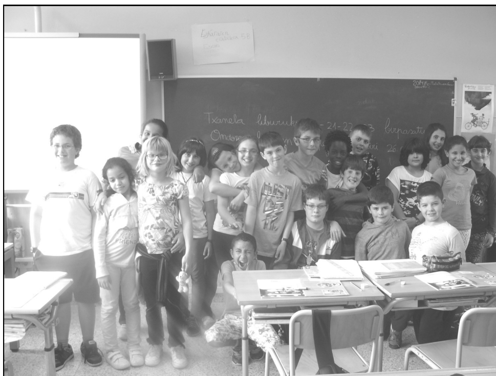
Lope de Larrea ikastola - Agurain 5. B