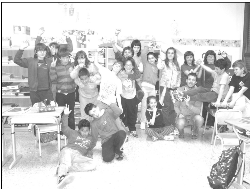
Lope de Larrea ikastola - Agurain 5. A