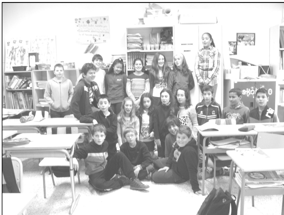
Lope de Larrea ikastola - Agurain 6. A