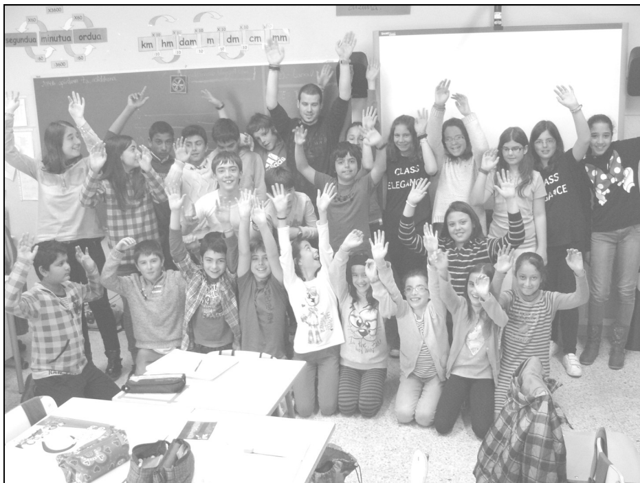
Lope de Larrea ikastola - Agurain 6. B