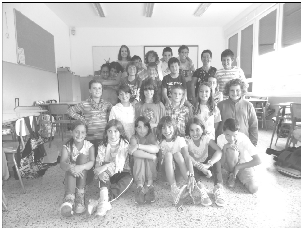
Dulantzi Eskola - Dulantzi 5. B