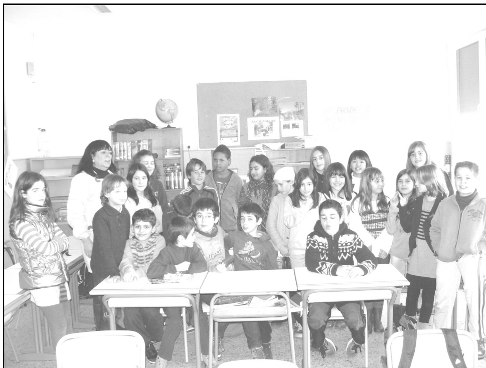
Dulantzi Eskola - Dulantzi 5. A