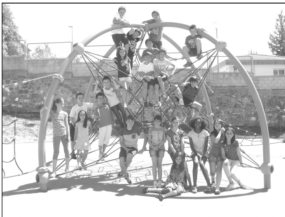
Lope de Larrea ikastola - Agurain 5. B