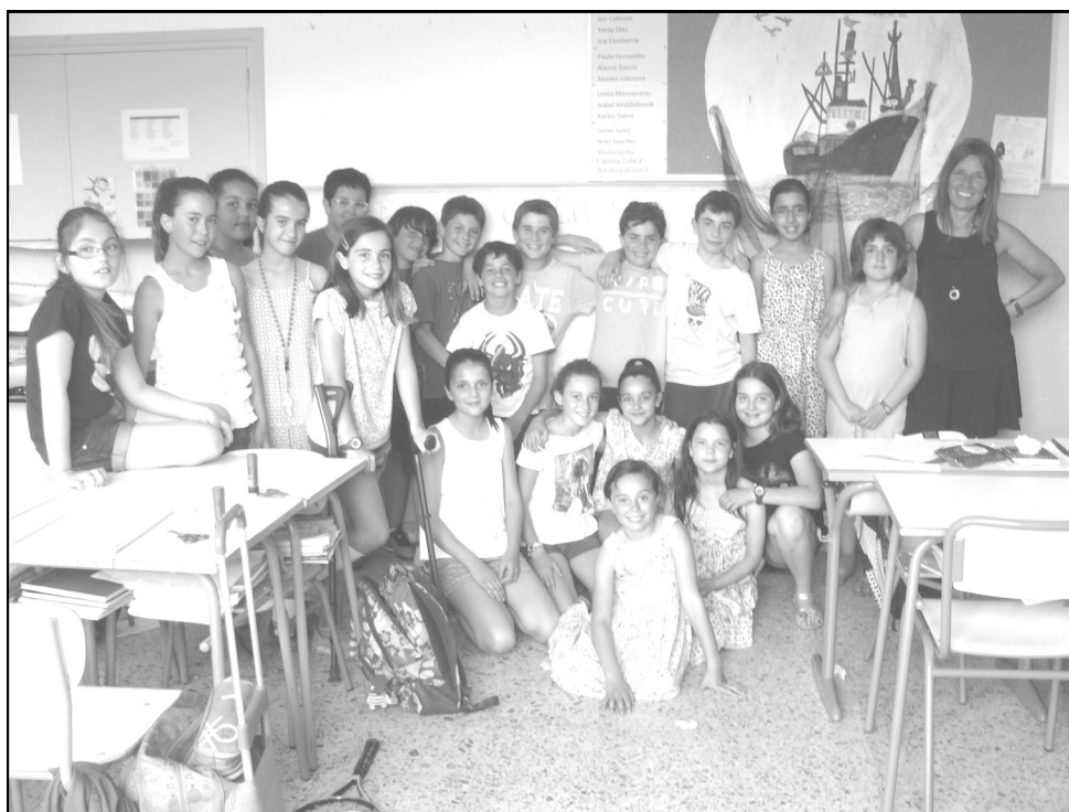
Dulantzi Eskola - Dulantzi 5. A