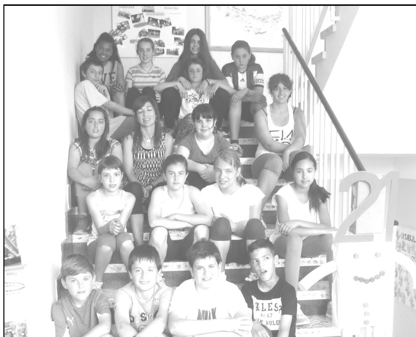
Lautada ikastola - Agurain 6. maila