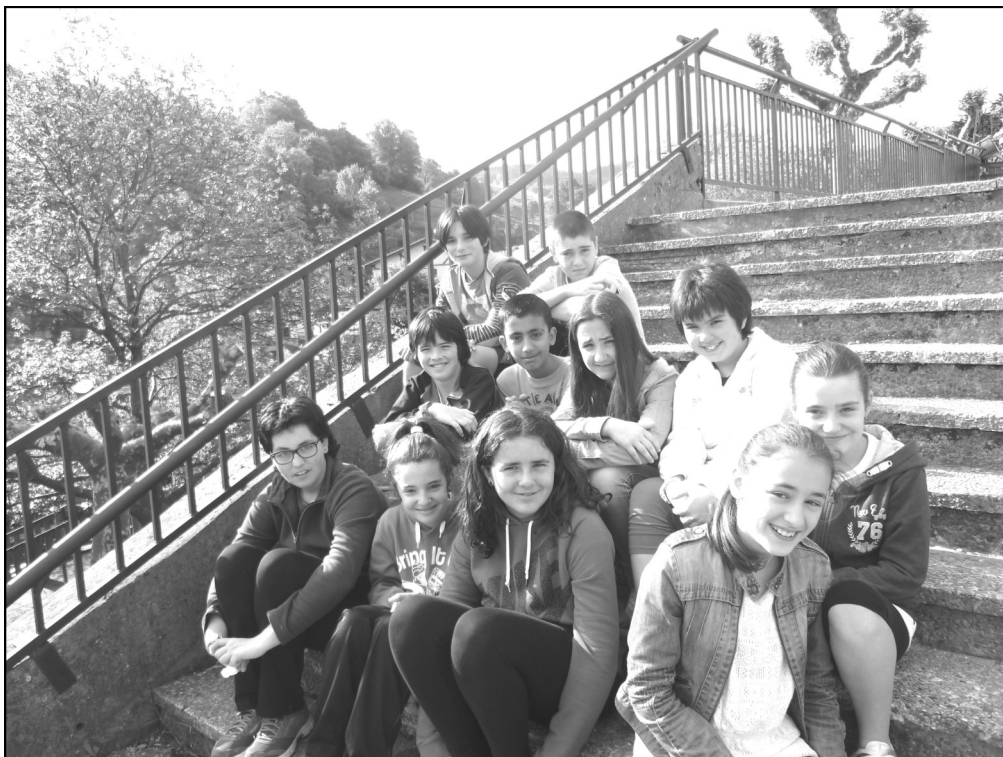
San Martin Eskola – Aramaio 6. maila

Plazer handia izan da Hona etortzea Honek eragin digu Klasea galtzea Denoi opa dizuegu Ondo pasatzea Agur ta ondo pasa Zuiako jendea