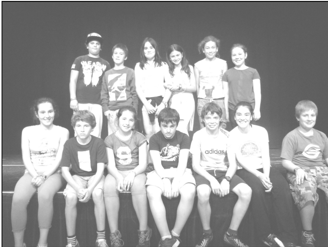
Garazi ikastola – Legutio 6. maila

Desberdina ta berezia da gu gaitu seme alaba Euskal Herria da gure herria gure hizkuntza euskara desberdina ta berezia da gure hizkuntza euskara