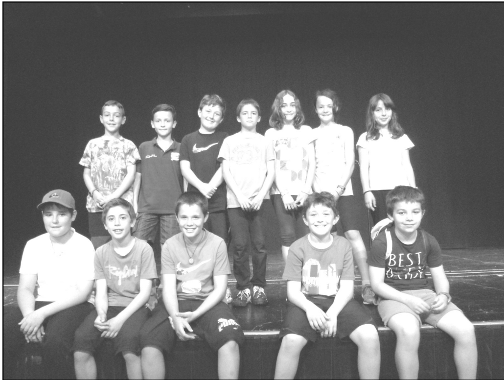
Gorbeia Eskola – Zigoitia 5. maila