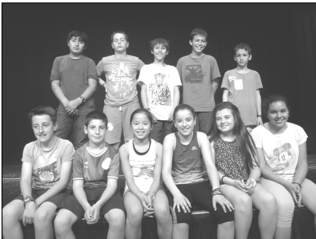
Gorbeia Eskola – Zigoitia 6. maila

Gaur etorri zarete gure Gopegira. Ay ze herri polita, frontoian distira! Murgia, Izarra, Legutio, Aramaio tira. Ongi etorri jende Gopegi herrira!