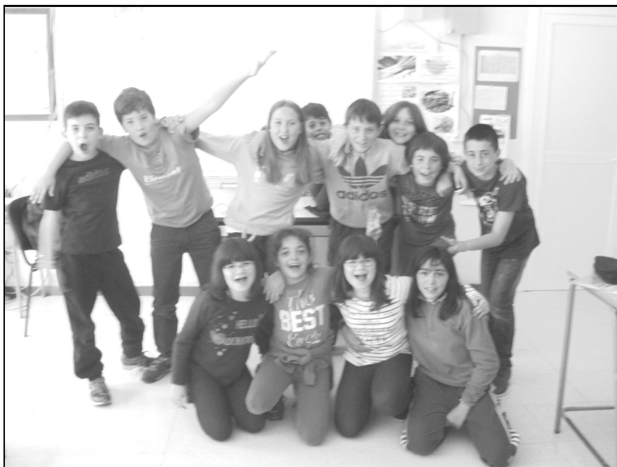
Assa ikastola – Lapuebla de Labarka 5. maila