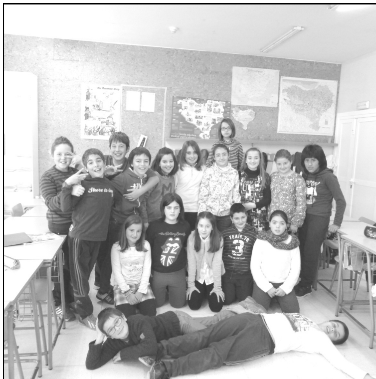
Assa ikastola – Lapuebla de Labarka 5. maila