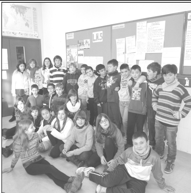
San Bizente ikastola – Oion 5. maila