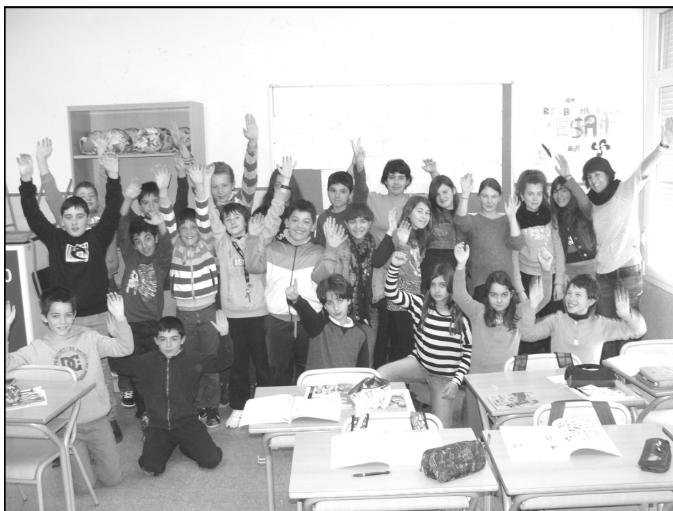
Jose Migel Barandiaran ikastetxea – Langraitz 6.A