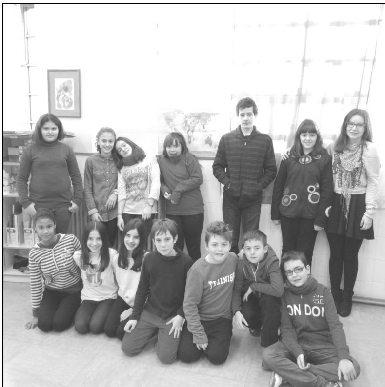
San Bizente ikastola – Oion 6. maila