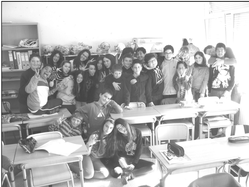
Jose Migel Barandiaran ikastetxea – Langraitz 6.A