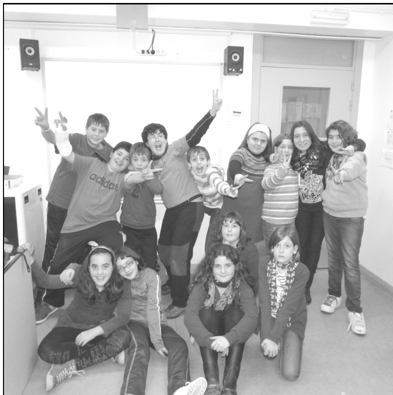
Bastida Ikastola – Bastida 6. maila