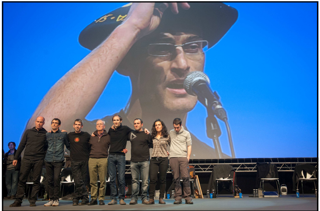
Txapelduna pantailan, lagunak begira

Urte berri bat, ehun ilusio, Preparatu zaitezte!... Pinganillotik esan digute Oso fuerte datorrela