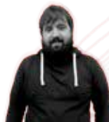
Xabi Lasa Arrizabalaga